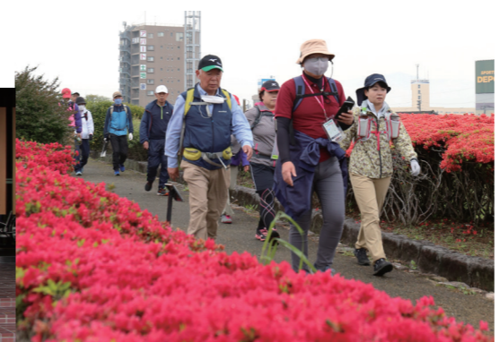
令和5年開催の様子。満開のつつじが道を彩ります

思い出を振り返り、代表で宣誓しました。育ててくれた両親には感謝の気持ちでいっぱい。専門学校を経て、4月から大学に編入します。勉学に励みつつ、留学などいろんな経験を積んでいきたいと思っています。