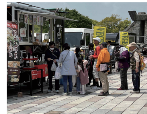
会場にはさまざまなキッチンカーが並びます

4月20日(土)、21日(日)の2日間で「第27回久留米つつじマーチ」を開催します。自然、歴史、文化をテーマにさまざまなウォーキングコースを用意しています。 会場の中央公園では、キッチンカーの出店やマルシェなどがあります。ウォーキングの後にはグルメを堪能できます。 【4月20日(土)】 ■40km・歴史の道草野・善導寺コース ■20km・大パノラマ森林つつじ公園コース ■10km・久留米市美術館石橋文化センターコース ■5km・つつじ祭り一万歩コース(バリアフリー) 【4月21日(日)】 ■30km・秋月街道・大刀洗コース ■20km・南北朝古戦場宮ノ陣・北野コース ■10km・