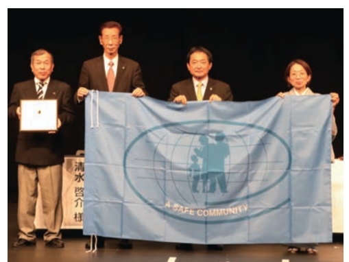
認証を記念して、国際セーフコミュニティ認証センターから盾と旗が贈られました

久留米市の「安全安心のまちづくり」の取り組みが評価され、3回目のセーフコミュニティ国際認証を取得しました。これまでの成果と取り組みのポイントを紹介します。 3回目の認証 「身の回りで起こるけがや事故は、予防で減らすことができる」というセーフコミュニティの基本的な考え方に基づき、市は、平成23年から市民の皆さんと協働して「安全安心のまちづくり」に取り組んでいます。 昨年8月に行われた国際認証審査