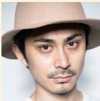
Pantovisco パントビスコ SNSの総フォロワー数が80万人を超えるクリエイター。久留米市出身