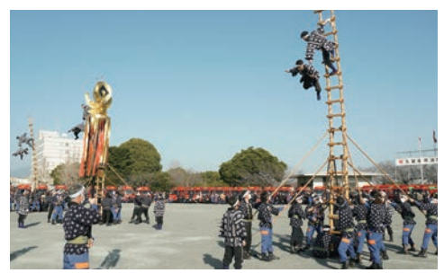
はしご隊の妙技の連続に、会場は緊張感に包まれます。

1月8日(祝)9時から久留米百年公園で、消防出初式が開催されます。消防署員、消防団員、関係者約1,300人が一堂に会し、4年ぶりに通常規模で開催。訓練披露、はしご乗り演技、分列行進、全国出場した女性消防隊の消防操法などが行われます。 ☎ 防災対策課 (☎38・5160、FAX 38・5240)