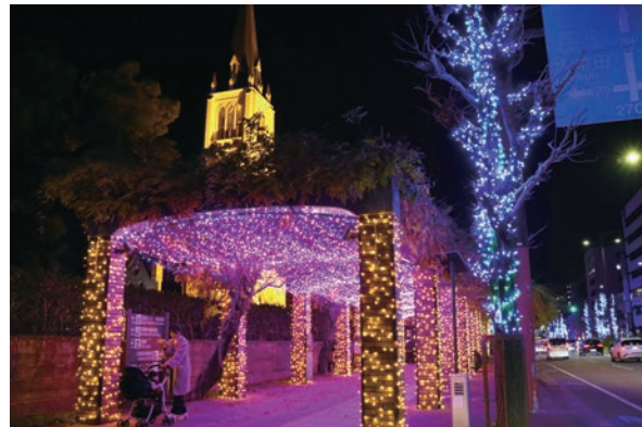
藤棚に設置された「光のトンネル」。ライトアップされたカトリック久留米教会もまちなかに彩りを添えます

12月8日に「第19回くるめ光の祭典」とめきファンタジー」が始まりました。久留米シティプラザの六角堂広場で点灯式を開催。来場者のカウントダウンで、明治通りや西鉄久留米駅東口広場などのイルミネーションが一斉に点灯しました。シティプラザ西側の六ツ門テラスや日吉町交差点近くには「光のトンネル」などのフォトスポットもあります。2月18日(日)まで。