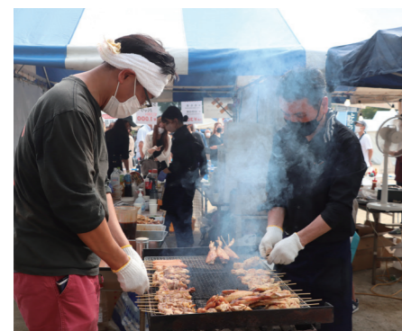
16ページに関連の記事があります