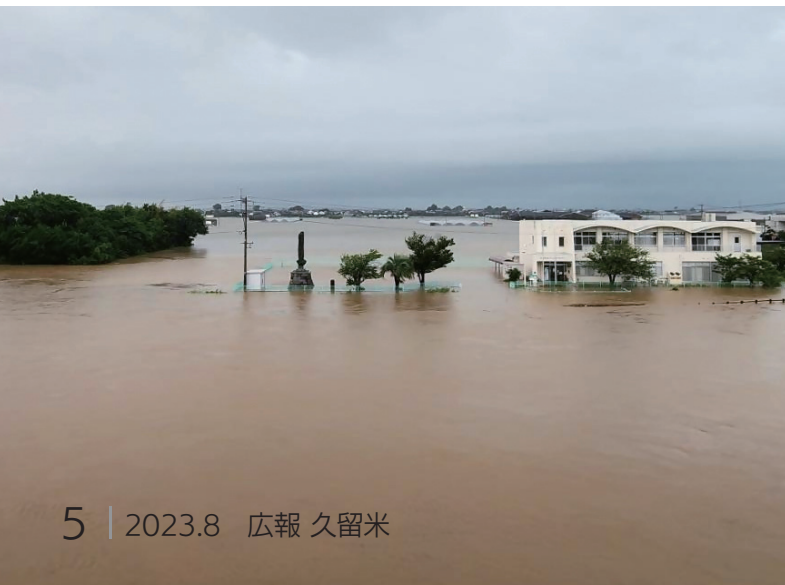
7月11日、写真手前の巨瀬川から越水。大橋コミュニティセンターが浸水しました