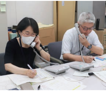
ごみ処分や証明書などの問い合わせに対応

「り災証明書」は、住宅の「全壊」から「準半壊に至らない（一部損壊）」まで6段階で被害の状況を証明するものです。支援金や制度の利用に必要な場合があります。申請により、市が被害状況を確認して、発行します。片付けや補修の後に申請する場合は、被害状況（浸水箇所や浸水の高さ）が分かる写真を撮っておいてください。撮り方は市ホームページに掲載しています。床下浸水の場合、写真だけで認定する「自己判定方式」での申請も可能。その場合は「準半壊に至らない（一部損壊）」となります。事業者の被害証明には「被災証明書」を発行します。 ◎生活支援第1・2課（☎0942・30・9023、FAX0942・30・9710）