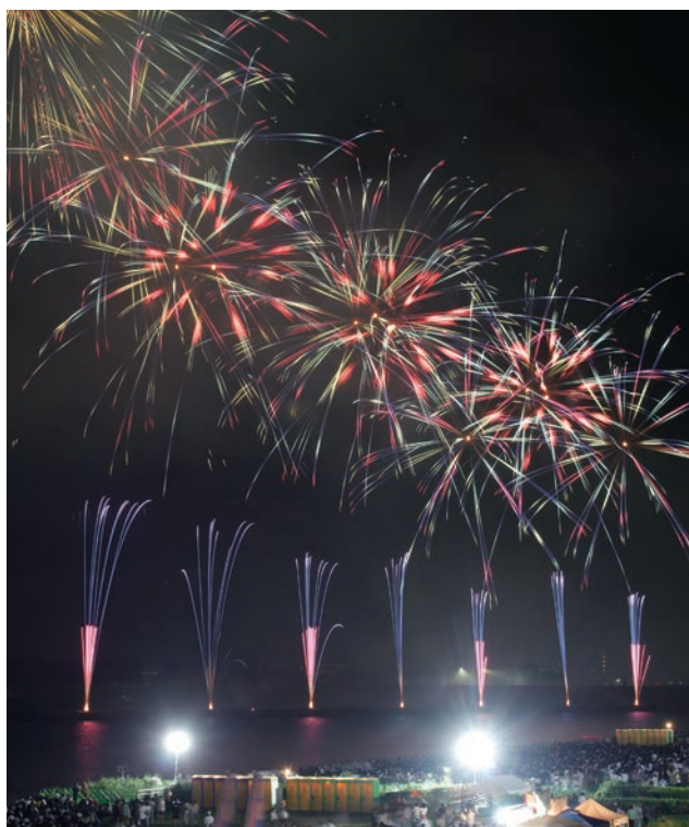
昨年の第363回筑後川花火大会の様子

※お願い 安全確保のため、交通規制を変更する場合があります。当日は現地の指示に従ってください