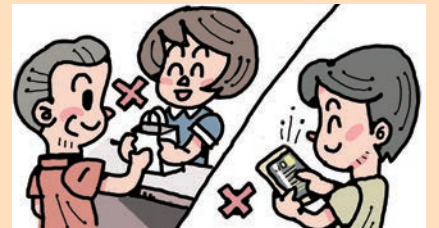
店舗に向いて購入した商品や通信販売にクーリング・オフ制度は適用されません

消費者側から一方的に契約を解除できるクーリング・オフ制度があります。ところが購入方法によって、適用されないこともあります。近年増えているインターネット通信販売も対象外です。よくある事例を紹介します。