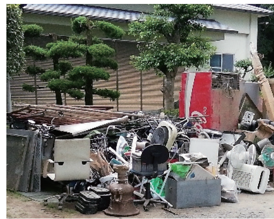
7月18日、大橋町石浦公園には、ぬれて使えなくなった家具が運び込まれました

かないといけないと思いました。日常を取り戻すため困っているときは、ボランティアを頼ってほしい」と話しました。 12日には、平成30年7月豪雨で被災した岡山県倉敷市から、土のう袋やブルーシートなどが到着。その後も国土交通省をはじめ、県や福岡市など他自治体から職員が派遣されました。須恵町から提供されたトイレトレーラーは現地の活動を支えました。復旧・復興に