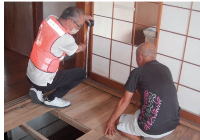
浸水した場所や高さ、外観を1件ずつ確認。被害の程度を判定します

◎消費生活センター （☎0942・30・7700、FAX0942・30・7715）