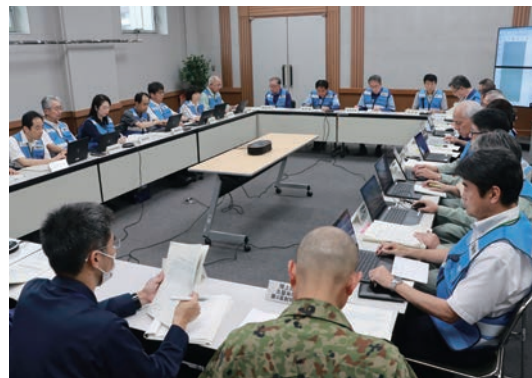
7月10日、災害対策本部を設置。国県と情報共有し、被害の把握を急ぎました

令和5年7月7日～10日 耳納山観測所 ・総雨量 567mm (4日間累積) ・1時間最大雨量 91.5mm ・24時間最大雨量 402.5mm