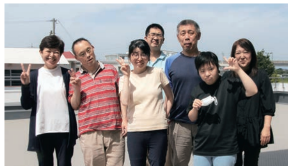
育成会の仲間と今日も笑顔

私には知的障害がある28歳の息子がいます。息子が小学生の頃、登下校で寄り道をしたり、病院の中を通り抜けたりして帰ることが度々ありました。探し回っていると警備の人や店の人が「あそこにいるよ」と顔と名前を覚えて教えてくれてとても助かりました。会員の中には、障害のあるなしに関係なく、放課後、小学校から