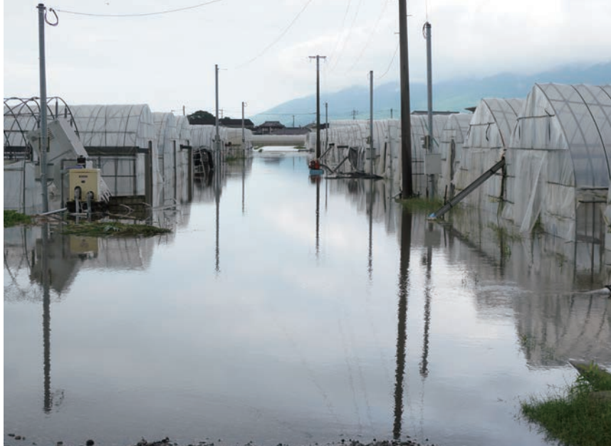
7月10日、北野町では農業用ビニールハウスが広範囲で、浸水しました