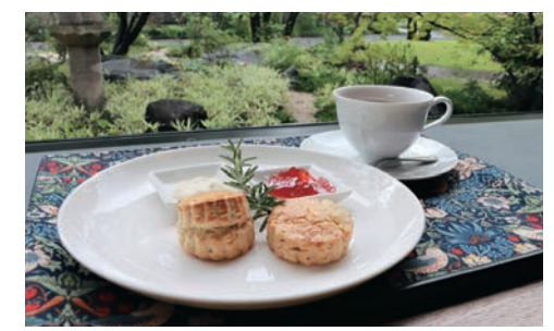
紅茶とブレインとローズマリー スコーンで優雅なティータイム

石橋文化センターのカフェ & ギャラリーショップ楽水亭では、市美術館で開催中のアーツ・アンド・クラフツとデザイン展にちなんで英国フェアを開催中です。本場のクリームティーセットなどを楽しめます。8月20日(日)まで。 ☎石橋文化センター (☎ 33-2271、FAX 39-7837)