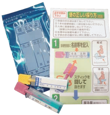
大腸がん検診のキット。便の採取だけで簡単です

大腸がん検診は便に血液が混じっていないかを調べる「便潜血検査」です。便を採取するだけなので、ほかのがん検診に比べてとても簡単。検診で異常が見つかったら、内視鏡検査を受け、がんかどうかをはっきりさせる必要があります。早期のがんなら内視鏡でがんを切り取るので、大きな手術は必要ありません。「大丈夫だろう」と自己判断して精密検査を受けないと、気付いた時にはかなり進行しているということにもなりかねません。大腸がんは早期発見できれば、5年生存率は90%を超えています。早期発見のために