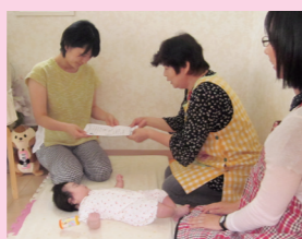
【新生児訪問への同行】 保健師の新生児訪問に主任児童委員が同行し、保護者と地域をつなぎます

◎家庭子ども相談課 (0942・30・9208、FAX 0942・30・9718)