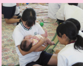
【赤ちゃんふれあい体験】 中学生が乳幼児とふれあい、命の大切さを知り、思いやりの心を育みます