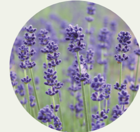
北海道中富良野町 ラベンダー