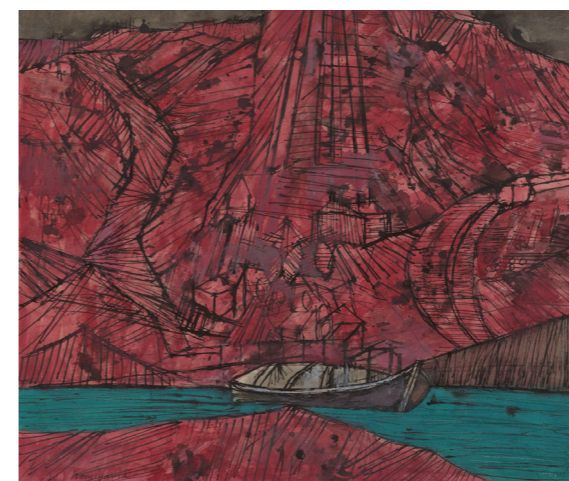
野見山暁治《ベルギーの皮艇》 1955-1956年 久留米市美術館

交流のあった香月泰男の作品などを展示。教師を辞めた後の作品も合わせて100年を見つめます。