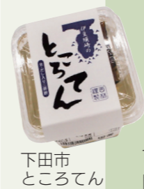
下田市 とろろてん

※12歳以上と小児接種の3回目以降ワクチンはオミクロン株対応 ※小児接種は個別接種も可能。乳幼児接種は個別接種のみ