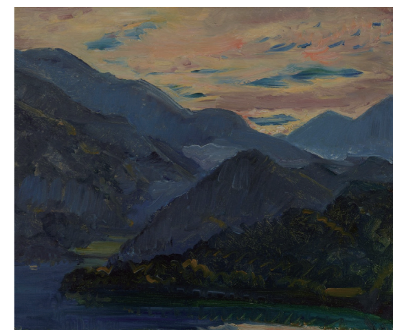
藤島武二《日月潭》 1935年 久留米市美術館

帰国後は、東京藝大で指導に当たりました。第5章は、同じ教壇に立った脇田和や特別講師に引き