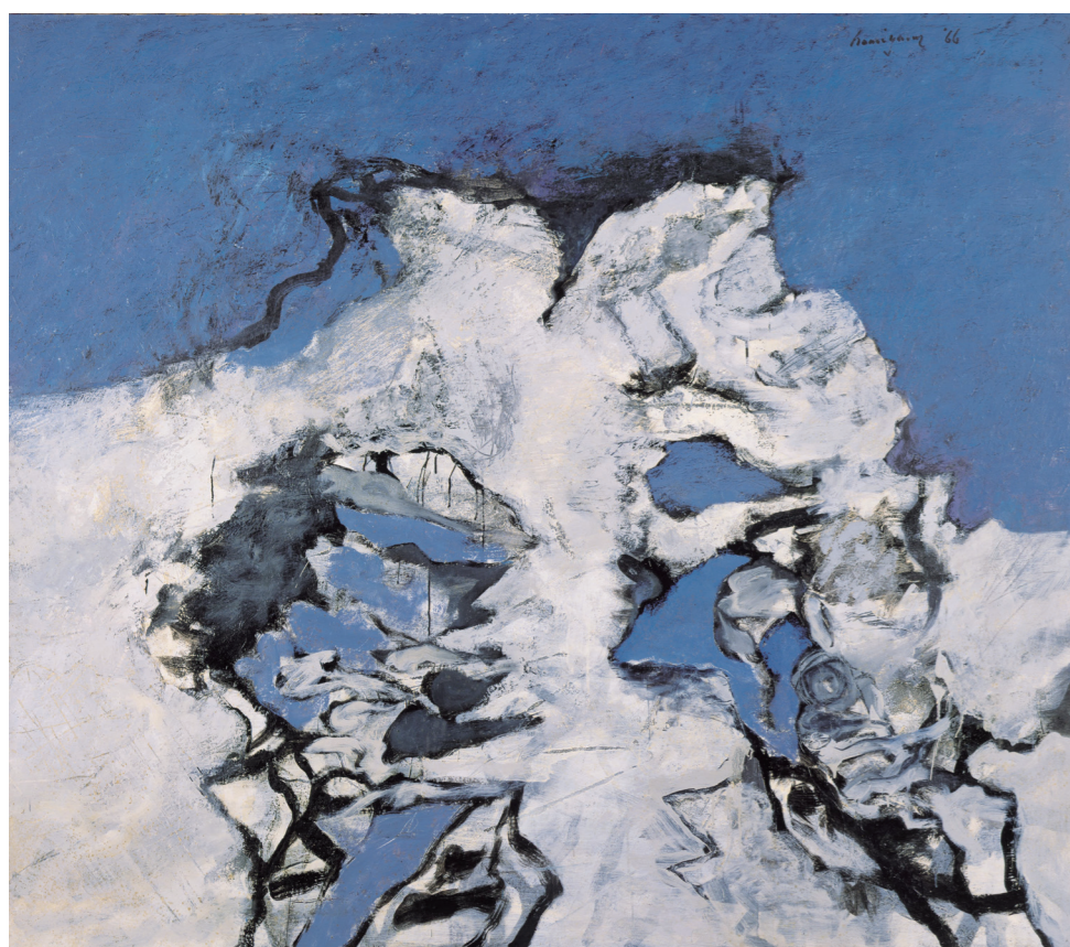
野見山暁治《蔵王》 1966年 福岡県立美術館

大正9(1920)年、福岡県飯塚市に生まれる。東京美術学校を卒業し、油彩画を中心に制作。令和5年現在も精力的に創作活動を行っている。