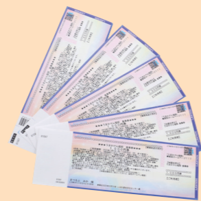
チケットの裏面は主催者からの注意事項が記載してあるので確認を

コロナ禍で制限されていたコンサートでの声援や収容人数などが緩和され、以前のような楽しみ方ができるようになりました。コンサートチケットにまつわる事例を紹介します。