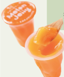
中富良野町 富良野メロンゼリー