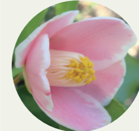
山口県萩市 ツバキ