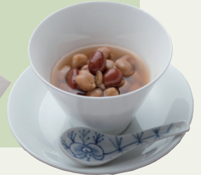
宝塚市 お豆ごろっとぜんざい