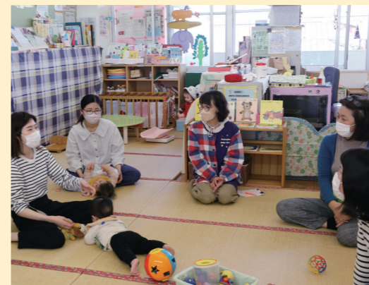
0歳児対象のサロンでは、子育ての悩みを保育士に相談したり、保護者同士で情報交換も

荒木、江南、松柏、善導寺、白峯、北野、城島、三瀬、田主丸の9カ所があります。親子で自由に遊んだり、保護者同士で交流したりするサロンを開催。妊娠中の人でも利用できます。保育士の子育て相談や家庭訪問なども行っています。 ■ 開所時間 月曜から木曜は、9時30分～12時、13時～15時。金曜、土曜は9時30分～12時(松柏のみ第4金曜を除く) ■ 休館日 日・祝日、年末年始