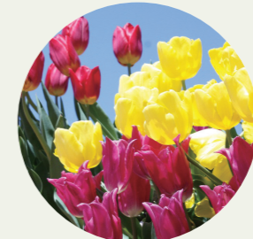
富山県砺波市 チューリップ