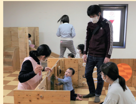
家にない遊具もあり、子どもも飽きずに遊べます

■ 場所 リバー5階(天神町8) ■ 開館時間 10時～18時 ■ 休館日 第2・4木曜、年末年始 ◎ 子育て交流プラザくるるん (☎0942・34・5571、FAX 0942・34・5572)