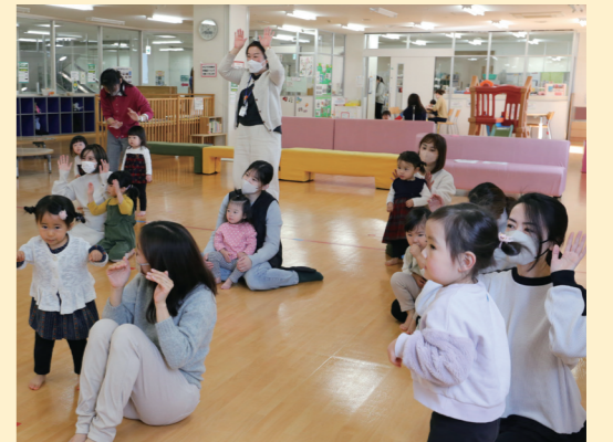
親子で一緒に参加できるイベントも開催

■ 場所 くるめりあ六ツ門5階(六ツ門町3の11) ■ 開所時間 10時～18時 ■ 休館日 月曜、年末年始。月曜が休日の場合は翌日 ◎ 児童センター (☎0942・35・3809、FAX 0942・35・3835)