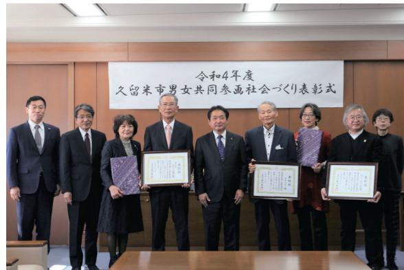
地域の男女共同参画社会づくりに貢献した受賞者の皆さんと原口新五市長（中央）

2月20日、本庁舎で「男女共同参画社会づくり表彰式」がありました。受賞したのは、デートDV防止啓発講座を行っている「NO!SHくるめ」と母子世帯などに食材を提供している「ボナベティ」、女性役員の増加率が高い「安武校区まちづくり振興会」の3団体。同振興会の原寛会長は「男女共同参画の取り組みを今後も地域で進めたい」と話しました。