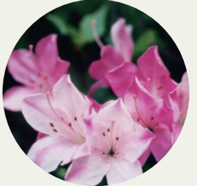
久留米市 久留米つつじ