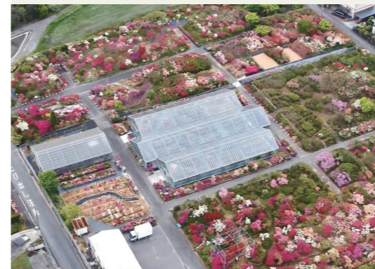
1万㎡ある世界つつじセンターは4月7日(金)から28日(金)まで一般開放します

物産展などを実施しています。4月22日(出)から27日(木)まで久留米ふれあい農業公園で、久留米つつじをはじめ、見頃の花々で耳納北麓の春をイメージした生け込みや、加盟都市の紹介パネルを展示します。予約不要、入場無料です。4月24日(月)は休館。 ㊤農業の魅力促進課(☎0942・30・9165、FAX 0942・30・9717)