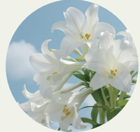
鹿児島県和泊町 コリ