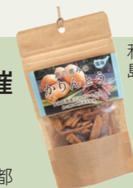
和泊町 島の恵みのかりんとう

道の駅くろめイベント広場で、フラワー都市交流連絡協議会の加盟都市の交流物産展を開催します。加盟都市がそれぞれブースを出店し、まちを代表する銘菓や加工品を販売。1,000円以上の購入でプレゼント抽選会への参加もできます。