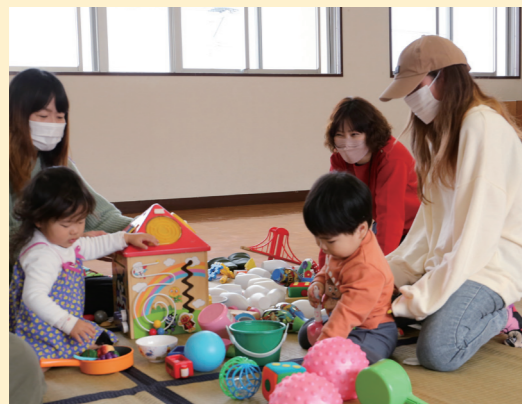
身近な場所で地域の人と交流したり、子どもを遊ばせたりすることができます