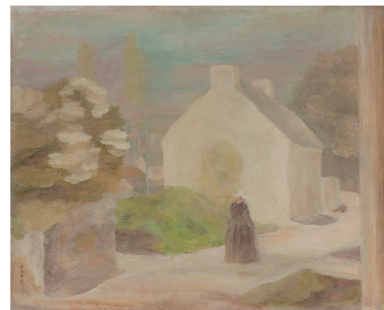
坂本繁二郎《ヴァンヌ風景》 1923年 久留米市美術館