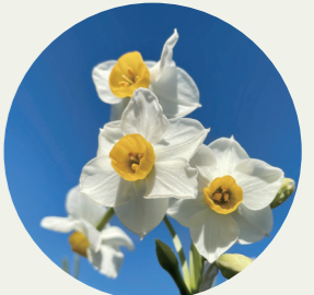
静岡県下田市 スイセン