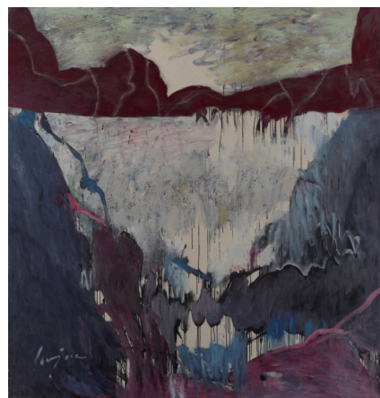
野見山暁治《これだけの一日》 2006年 久留米市美術館