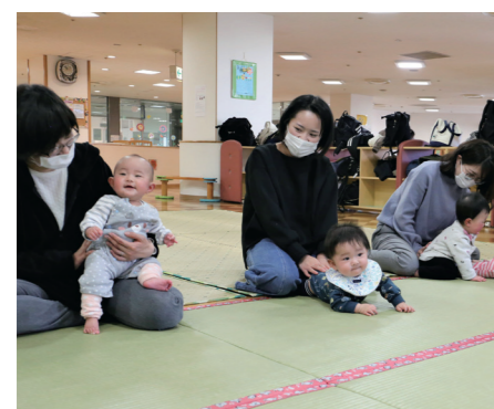
8～9ページに関連の記事があります

〇〇カ所 久留米市は、親子で楽しめる憩いの場として子育て支援拠点施設を設置しています。施設は市内に何カ所あるでしょう。〇に数字を入れてください。 3月号の答え → 正義