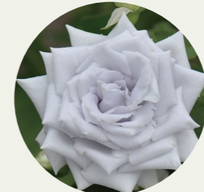
岐阜県大野町 パラ