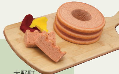
大野町 薔薇のバームクーヘン