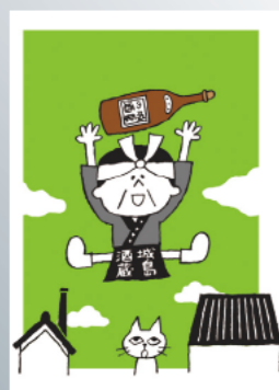
城島酒蔵びらきキャラクターサケゾー

駐車場は2カ所です。筑紫の誉付近のアテックス駐車場と城島総合運動公園。飲酒運転防止対策協力金として1日1000円で駐車できます。当日は、城島げんきかんと城島図書館は閉館します。