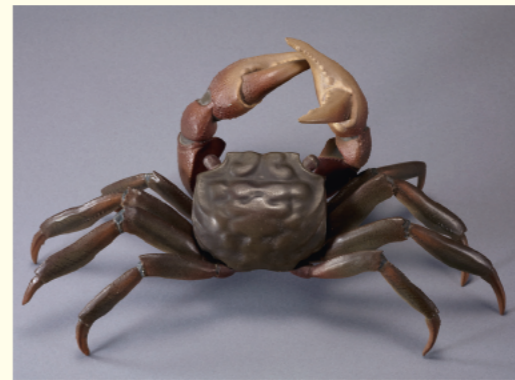
松本喜三郎《カニ》 1888年 公益財団法人島田美術館蔵