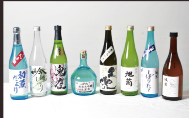
8蔵がお勧めする銘酒。会場にはこのほかにもたくさんの酒が並びます