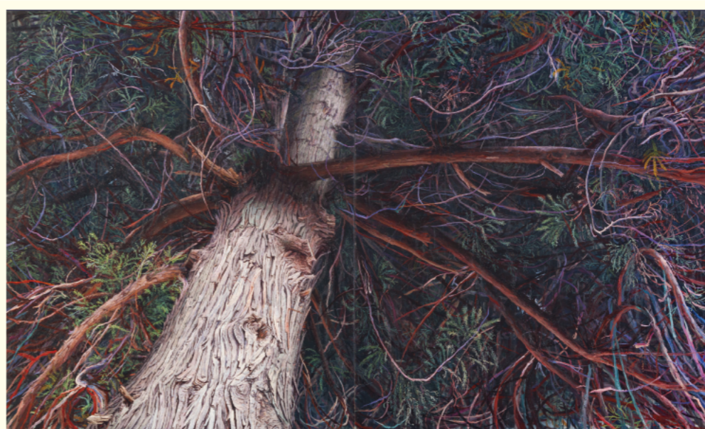
水野暁《日本の樹・二本の杉（白山神社／東吾妻町・伊勢の森／中之条町）》 2018-22年 個人蔵