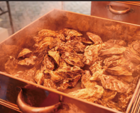
「Kaki×Sake Bar(カキサケバー)」が今年も登場。カキ用の限定酒も用意