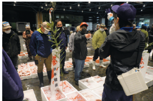
水産物部の競りでは、買受人が手ぶりで競り人に値段を伝えていました

1月5日の早朝、鮮魚を取り扱う市地方卸売市場水産物部と青果を取り扱う市中央卸売市場で、初競りが行われました。原口新五市長のあいさつの後、万歳三唱を皮切りに、取引を開始。場内には競り人の威勢の良い掛け声が響き、活発な取引が行われました。初日の取引量は、水産物が22・4tで約3800万円、青果物は140・5tで約4800万円でした。