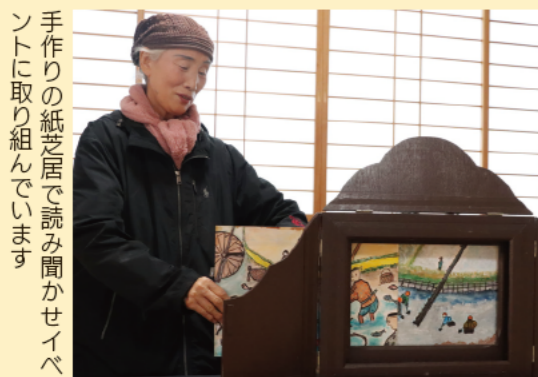
手作りの紙芝居で読み聞かせイベントに取り組んでいます

活動のきっかけは、子どもの頃の経験です。お菓子を買うと見ることができた紙芝居屋に、お金を持っていなかったことで断られてしまいました。とても悔しくて、お金がなくても誰もが楽しめるものを作りたいと強く誓った出来事でした。約40年前から仲間と一緒に紙芝居の読み聞かせイベントなどに取り組んでいます。場所は久留米市内や全国各地の小学校や公民館。コロナ前は1人1品料理を持ち寄り収穫祭「田んなかっ祭」も開催していました。遊びに来ていた子どもが親になり、自分の子どもを連れて参加することもあります。このつながりを大切に活動を続けていきます。