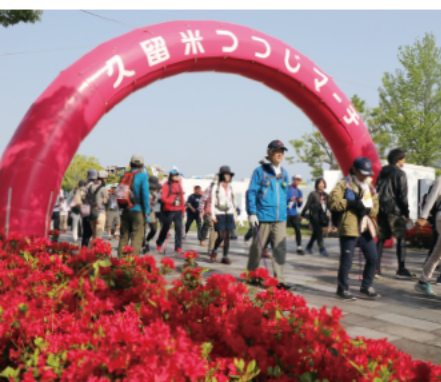
満開のつつじがスタート地点を彩ります

新型コロナウイルス感染症予防で、「せっかくウォーク」や「ウェルカムパーティ」「キッズウォーク」は実施しません。 ◎久留米つつじマーチ実行委員会事務局(久留米観光コンベンション国際交流協会内、☎0942・31・1777、FAX0942・31・3210)