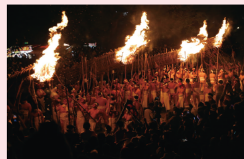
1月7日、大善寺玉垂宮で3年ぶりに鬼夜が開催され、境内は観客で埋め尽くされました。火の粉に当たると無病息災といわれています。