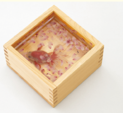
深堀隆介《桜升 命名 淡紅》 2017年 平塚市美術館蔵