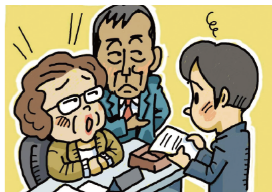
育休を取る際に、性別を理由として、文句を言われることは性差別です

相談したい人は、所定の用紙に必要事項を記入後、問い合わせ先(持参、または郵送)してください。用紙は、問い合わせ先と男女平等