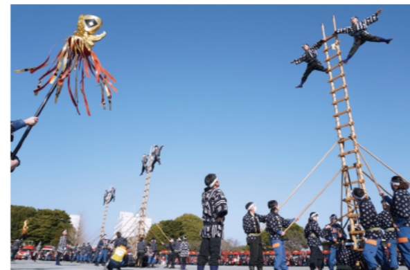
約8メートルもの高さがあるはしごで技を披露しました

1月9日に久留米百年公園で「久留米市消防出初式」が行われました。参加したのは、市内消防機関の関係者ら約900人。永年勤続表彰などのほか、消防署による訓練展示や分列行進を行いました。式の半ばには、市消防団の有馬火消しはしご隊による伝統的な「はしご乗り」も。新調した久留米紉製の法被をまとって華やかに技を披露し、観客からは盛んな拍手が起きました。