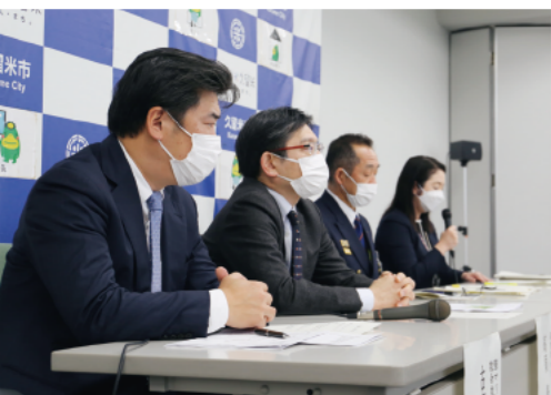
1月13日、聖マリア病院、久留米大学病院、久留米広域消防本部、市保健所が合同で会見を開きました

学生以下の子どもに、のどの痛みや発熱などの症状が出た場合は、医療機関に電話で相談をしてから受診しましょう。重症化リスクが低い人は、検査キットの活用も。 ③一人一人が感染対策の徹底を マスクの着用、手洗い、3密の回避など、基本的な感染防止対策を徹底しましょう。 ④総務医薬課 (☎0942・30・9724、FAX0942・30・9833)