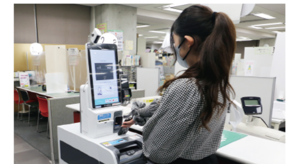
窓口で職員との接触を減らすことができます

【コード決済】PayPay、au PAY、メルペイ、楽天ペイ、d払い、J-Coin Pay、Bank Pay、ゆうちょPay、Alipay、WeChat Pay ※窓口で電子マネーなどのチャージはできません。 ㊤市民課 (☎ 30・9027、FAX 30・9758)