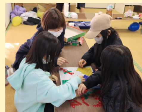
ボードゲームやカードゲームなどおもちゃも用意されています