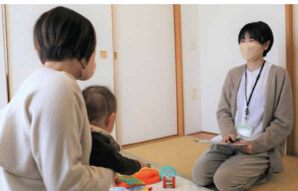
面談では、専門職に不安なことなども気軽に相談できるので安心です

久留米市は、全ての妊産婦や子育て家庭が安心して出産・育児ができる環境づくりを進めています。今回、相談支援と経済的支援の取り組みを一体化した新たな取り組みを行います。