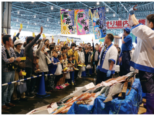
真剣に競り合う参加者たち