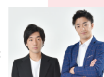
インクルージョン (福岡よしもと)