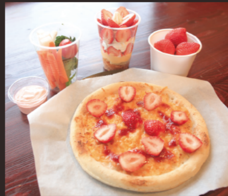
新たにイチゴを楽しめる店が登場。新鮮なイチゴを使ったメニューは逸品ばかり