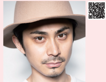
Pantovisco パントビスコ SNSの総フォロワー数が80万人を超えるクリエイター。久留米市出身