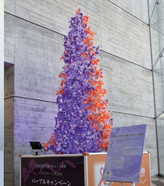
オレンジ&パープルツリーを設置し、暴力根絶に向けて普及啓発します

11月25日は「女性に対する暴力撤廃国際日」です。内閣府は11月12日から25日までの2週間を「女性に対する暴力をなくす運動」期間と定めています。DV(ドメスティックバイオレンス)配偶者や恋人などからの暴力)や性暴力、ストーカー行為などは、個人の尊厳を害する重大な人権侵害です。久留米市は、女性に対する暴力