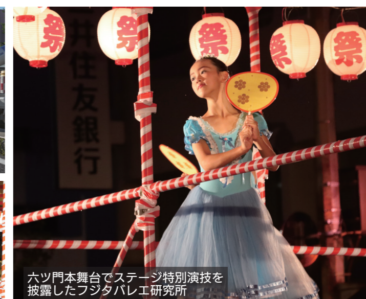
六ツ門本舞台でステージ特別演技を 披露したフジタバレエ研究所