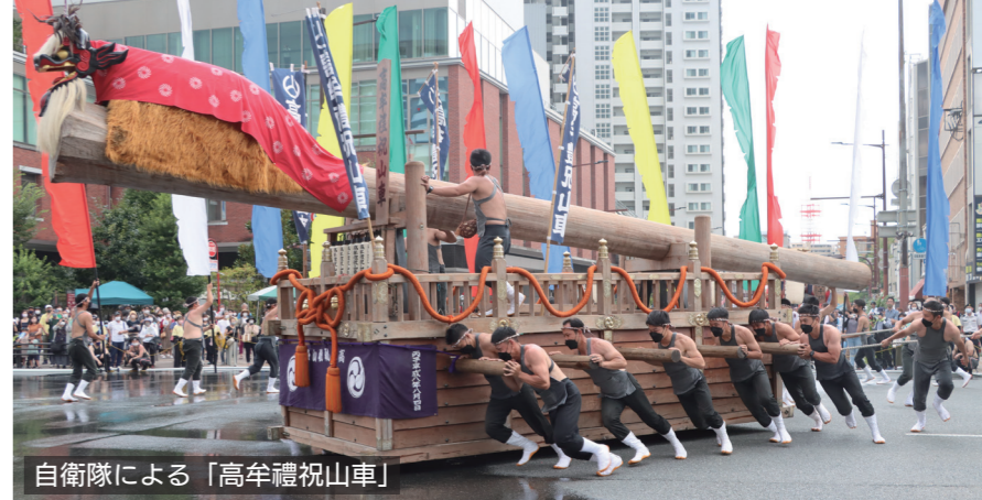
自衛隊による「高牟禮祝山車」