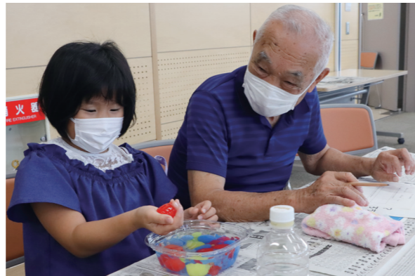
参加者は、出来上がった水の塊を触ったり、さまざまな方向から見たりして変化を確かめていました

環境交流プラザで、子ども夏休み教室「エコなつ」が開催されました。内容は、環境をテーマとした実験や工作で全15回。7月30日の「指でつまめる、不思議な水をつくるう」には、子ども15人と保護者が参加しました。海藻の成分で膜を作ると、持ち運びができることから、プラスチック容器削減のアイデアとして紹介。水の塊に触れた参加者は、ぶよぶよした感触に歓声を上げていました。