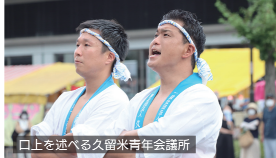
口上を述べる久留米青年会議所