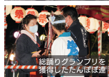
総踊りグランプリを 獲得したたんぼ連