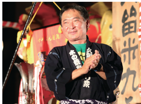
六ツ門本舞台から踊り連に声援を送る原口新五市長