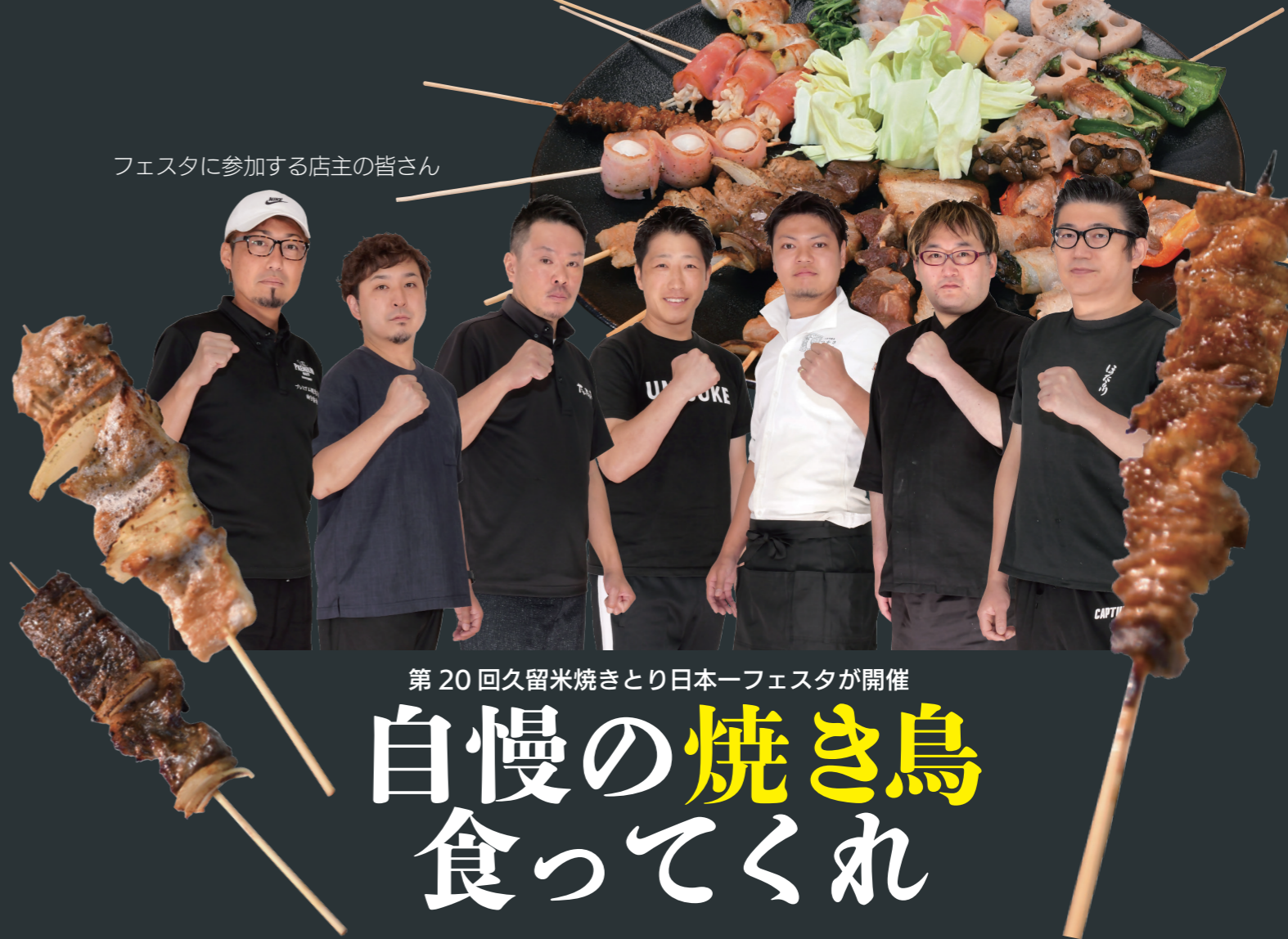
フェスタに参加する店主の皆さん