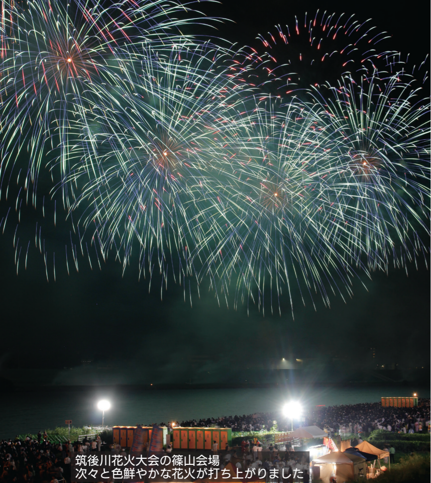
筑後川花火大会の篠山会場 次々と色鮮やかな花火が打ち上がりました