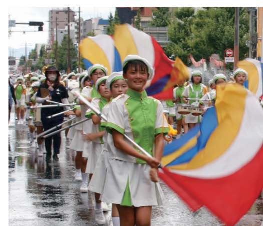
華やかな旗さばきで 観客を魅了しました