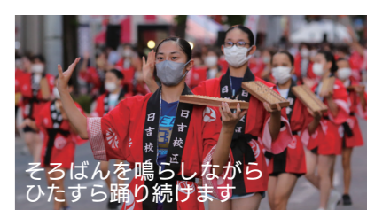
そろばんを鳴らしながら ひたすら踊り続けます