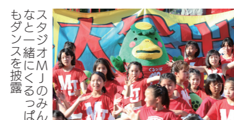
スタジオMJのみんなと一緒にくるっぴもダンスを披露