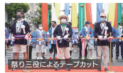
祭り三役によるテープカット