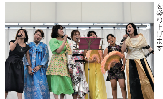
華やかな民族衣装でステージを盛り上げます

10月2日(日)、久留米シティプラザ六角堂広場で「第9回 Kurume こくさい Day」を開催します。ステージでは各国の伝統音楽や踊りを披露。会場には国際色豊かなグルメ屋台も登場し、自慢の料理やスイーツを楽しめます。雑貨の販売や国際交流団体の活動状況の展示もあります。時間は12時から16時まで。会場に来る際は、感染防止対策に協力してください。 ④久留米観光コンベンション国際交流協会 (☎31・1717、FAX 31・3210)