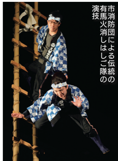
市消防団による伝統の 有馬火消しはしご隊の 演技