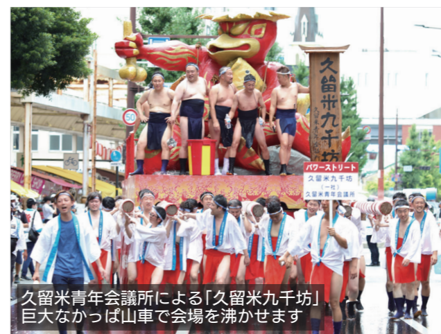
久留米青年会議所による「久留米九千坊」 巨大なカッパ山車で会場を沸かせます