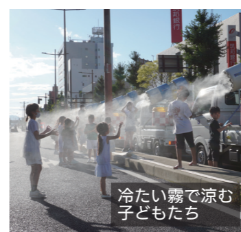
冷たい霧で涼む 子どもたち