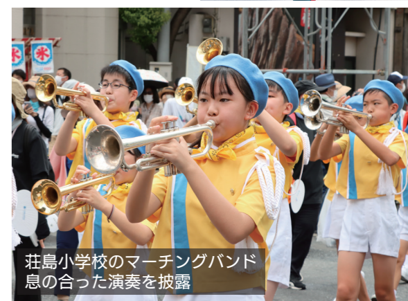
荘島小学校のマーチングバンド 息の合った演奏を披露