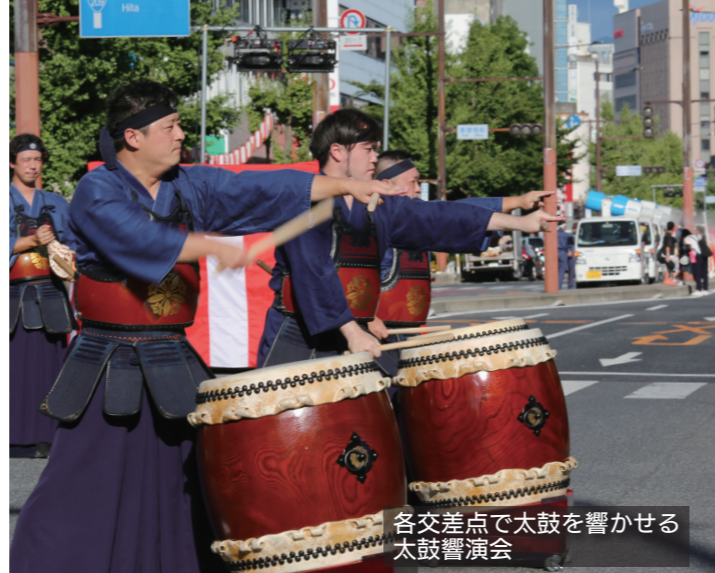
各交差点で太鼓を響かせる 太鼓響演会

などの踊りの技量、活気とチームの統一性など踊り連としての総合力が評価されました。5日に開かれた筑後川花火大会は、約8000発の打ち上げ花火に約40万人が訪れ、次々と打ち上がる花火に歓声をあげていました。今年も、新型コロナ感染拡大防止のため、家からでも花火大会を楽しめるように、初めてYouTubeで生配信しました。 ◎久留米観光コンベンション国際交流協会（☎0942・31・17 17、FAX0942・31・3210）