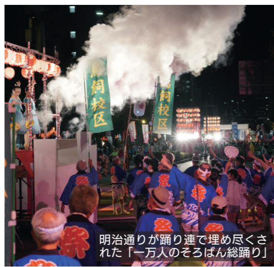
明治通りが踊り連で埋め尽くされた「一万人のそろばん総踊り」