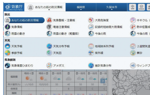
気象庁のホームページ

気象庁のホームページで、雨雲の動き、アメダス、キキクル（洪水や土砂の危険度分布）、今後の気象予測などが確認できます。「あなたの街の防災情報」で、見たい情報をカスタマイズして表示することができます。