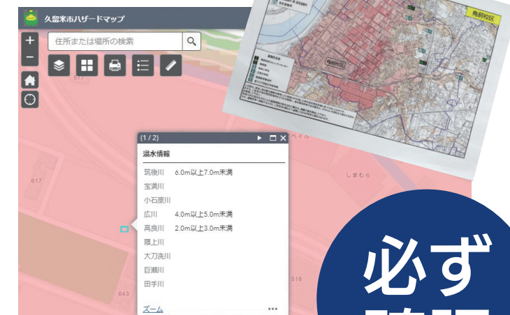
色の濃さで、浸水の深さが分かります