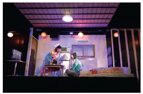
◀「妖精の問題デラックス」

の本質を問います。■ 開演日時 12月17日(土)18時、18日(日)15時 チケットの取り扱い扱いは、シティプラザWEB、シティプラザ2階総合受付 ☎久留米シティプラザ (0942・36・3000、FAX 0942・36・3087)