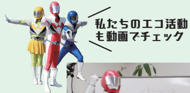
私たちのエコ活動も動画でチェック

環境活動の功績をたたえる 環境フェアに合わせて「くるめ環境交流プラザでは、ごみ分別カードゲームなどのワークショップも開催予定です。