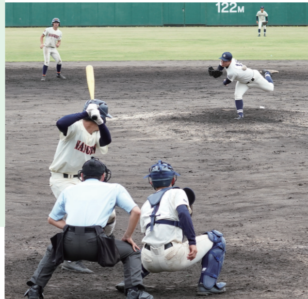
勝利をつかむために両校の選手が投打に全力を尽くしました

南筑創立百周年記念で 5月11日に、第73回久南定期戦が開催されました。例年、久留米商業高校と南筑高校の野球部が市長杯をかけて激闘を繰り広げる一戦です。新型コロナウイルスの影響で中断し、3年ぶりの開催。今年は南筑高校の創立100周年を記念して、午前には久留米アリーナで女子バレーボール、バドミントン、剣道の対戦もありました。オープニングセレモニーでは南筑がダンス、久留米空手道部が演武を披露し、華を添えました。 午後からは市野球場で野球部の