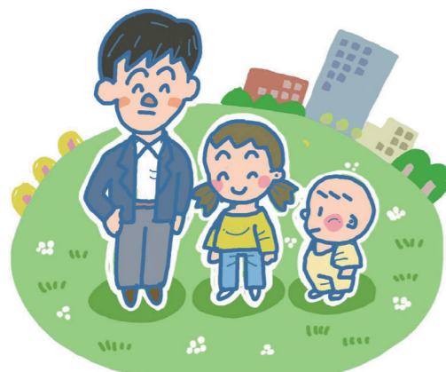
低所得の子育て世帯を応援します

■支給時期 ①は6月30日(木)に児童扶養手当を支給する口座に振り込み。②は7月末までに手当を支給する口座に振り込み予定。③は申請書受け付け後、申請日の翌月末に順次振り込み予定 ◎家庭子ども相談課(☎0942・30・9739、FAX0942・30・9718)