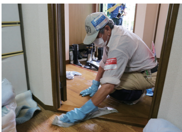
浸水した床を拭き上げるボランティア

災害が発生すると、私たちは、地域を回って浸水状況や必要な支援などを調査します。被災された皆さんは、一日も早く生活環境を