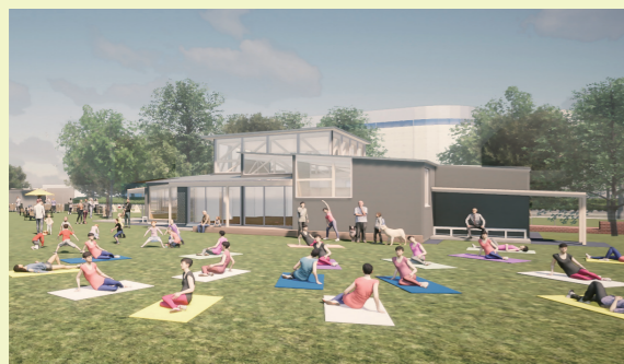
イメージ図。芝生広場では、青空ヨガやスポーツ教室も開催します