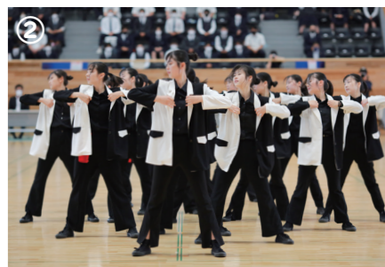
①会場を厳粛な空気に包み込んだ久留米空手道部 ②開会の華を添えた南筑ダンス部 ③スピード感のある打ち合いを繰り広げたバドミントン部 ④強烈なスパイクを打ち込む南筑女子バレー部 ⑤駆け引きから一瞬の隙を狙う剣道部