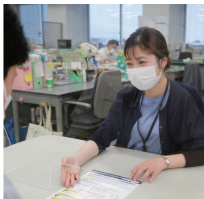
市民に寄り添った対応が求められます

なります。必ず、受験資格や試験内容などの詳細をまとめた試験案内を確認してください。受験申込書や試験案内は、市ホームページからダウンロードできます。郵送請求も可能です。 ◎人事厚生課 (☎0942・30・9056、FAX 0942・30・9706)