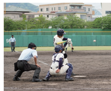
8ページに関連の記事があります