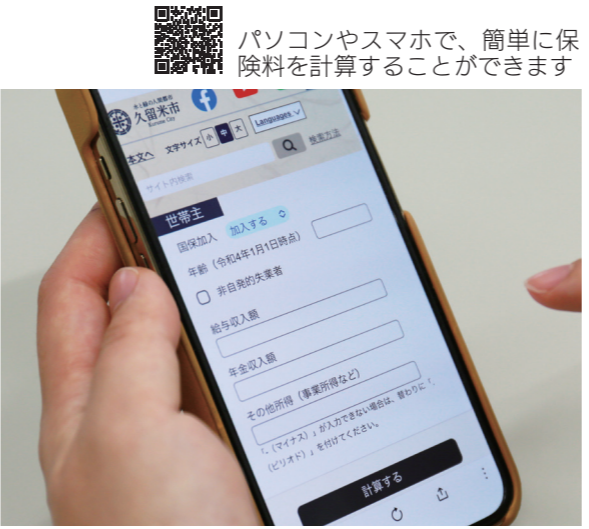
パソコンやスマホで、簡単に保険料を計算することができます

保険料の納付は、納付書や口座振替、年金からの天引きがあります。9月30日(金)までに新規で口座振替を申し込むと、先着で2000人にクオカード5000円分をプレゼントします。 ☎健康保険課 (0942・30・9030、FAX 0942・30・9751)