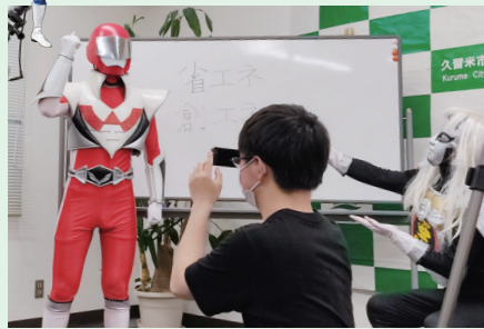
久留米工業高等専門学校の学生と共同で動画などを制作しています