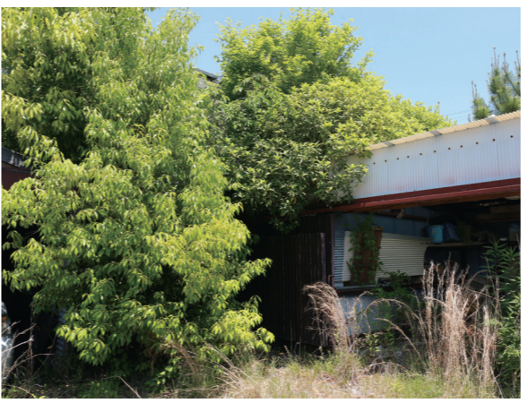
生い茂った雑草や樹木は、治安の悪化にもつながります

■景観が悪化して不法投棄や治安の悪化につながる ■火災など災害リスクが高まる 所有する土地が、周囲に迷惑を掛けないように、年に数回は、草刈りや樹木の枝切りを行うなど適正に管理してください。自身で管理ができない場合は、代行してもらうのも一つの方法です。