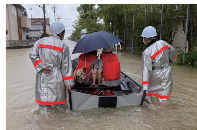
昨年8月の大雨災害で地域住民をボート救助した第11分団

回復したいと、無理を重ねています。中には、「ボランティアの皆さんも大変だから」、「何度もお願いしていいのかわからない」とおっしゃる人も。以前、支援に入った家で、床上浸水でベッドがぬれたにも関わらず、そこで3日も寝ていた高齢者がいました。困っていることを言い出せなかったんだと思います。すぐに貸出用のベッドを手配しました。支援を続ける