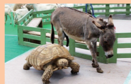
小さな動物たちと触れ合おう