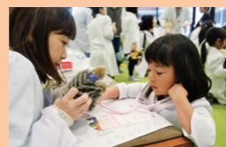
お医者さんや大工さんに挑戦