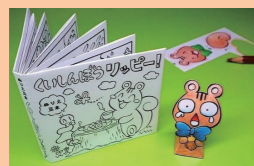
豆絵本を作ってみよう