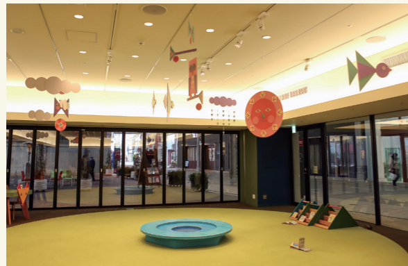
カタチの森は、9時から19時まで。休憩スペースや子どもの遊び場として利用できます

シティプラザ内の六角堂広場では、子ども向けのイベントや映画の上映、マルシェなどを行うこともあります。広場や商店街から自由に入れて、誰でもくつろげる交流スペース「カタチの森」は、アートユニット「tuppera tuppera」が内装をプロデュース。おしゃれで楽しい空間になっています。授乳室や多目的トイレにもイラストがあり、見て楽しめる工夫がされています。