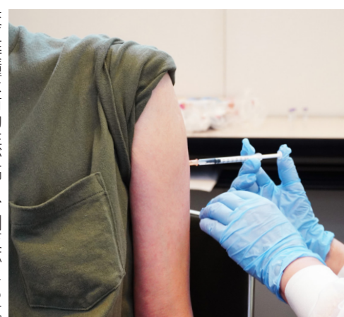
交互接種は有効性が高く、副反応にも大きな差はありません

これが3回目の接種で発症予防効果は約75%、入院予防効果は約95%まで上昇。接種後3カ月までの死亡抑制効果に至っては、最大で約99%まで高まります。2回目接種から6カ月経過後は、できるだけ早く3回目の接種を行うことを勧めます。