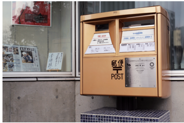
ゴールドポストの横には、素根選手のパネルや直筆のサイン、広報久留米号外を展示しています

2月14日、日本郵便が市役所東側にゴールドポストを設置しました。東京2020オリンピックで金メダルを獲得した選手のゆかりの地を盛り上げるプロジェクトです。ポストには、本市出身で金メダリストの素根輝選手の栄光をたたえるプレートも。久留米郵便局の首藤公文局長は「素根選手の偉業を忘れないためにも、皆さんに利用してほしいです」と呼び掛けました。