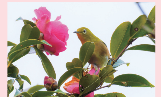
久留米市世界のつばき館では、各国のツバキが楽しめます。表紙の乙女椿は、ブランド「チャンネル」のモチーフといわれています。