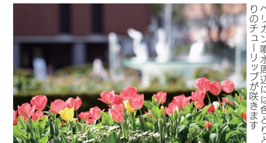
パリーカン噴水周辺には色とりどりのチューリップが咲きます。

石橋文化センターでは、ツバキが見ごろを迎えています。4月になるとサクラやチューリップが咲き誇ります。ビオラ、ポピー、アネモネなど花壇の花も4月下旬頃まで咲いています。四季の中で、最も多くの花を見ることができます。 ☎同センター (☎ 33・2271、FAX 39・7837)