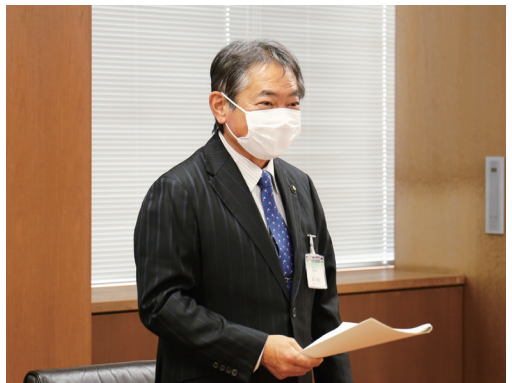
今後のまちづくりや各部局の懸案課題について意見交換をしました