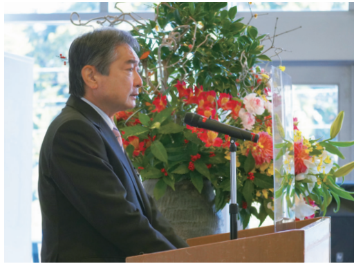
1月31日の初登庁日は、市の幹部職員を前に訓示を述べました