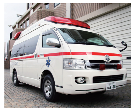
14ページに関連の記事があります