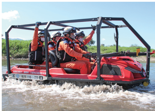
令和3年8月の大雨災害で活躍した水陸両用バギー

火災件数は121件で、前年から13件増加。3日に1件の頻度で火災が発生しています。火災の種類は、建物火災が71件、車両火災が18件、その他の火災が32件でし