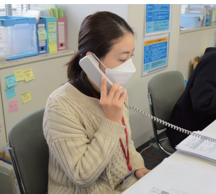
まずはコールセンターに電話してください