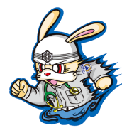
スーパーラビット

病程度別にみると、重症以上13・8%、中等症43・5%、軽症42・7%で、平成21年の久留米広域消防本部発足以降、初めて中等症が軽症を上回りました。一般負傷により搬送された人は3184人で、転倒や転落による受傷が82%を占めます。室内にまずくような物を置かない、移動する際は足元を明るくするなどの対策が必要です。