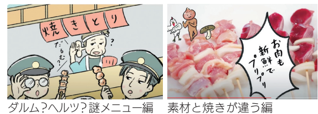
ダルム?ヘルツ?謎メニュー編 素材と焼きが違う編

久留米焼きとり文化振興会が、「久留米焼きとり」の歴史や魅力を紹介する動画を制作し、YouTubeに公開しています。ダルム・ヘルツがドイツ語に由来するルーツや、串の種類の豊富さなどをイラストや写真で伝えます。動画は、短編7本と総集編の計8本。焼き鳥を食べたくなること間違いなし。 ☎同事務局 (☎ 27・5616、FAX 31・3210)