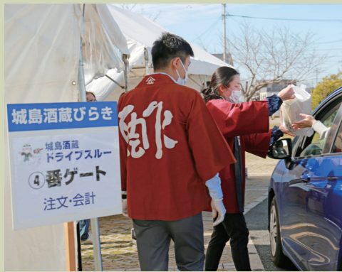
昨年のドライブスルー販売の様子。感染症対策を徹底したスタッフが接客します

城島町と三瀧町を中心とした8酒蔵が合同で新酒を販売します。酒の他に「朝摘みあまおうの苺パフェ」や「8蔵元をイメージした個性豊かな8種のソースが選べるハンバーガー」、「フルーツビネガードリンク」も販売予定。銘酒や特産品をぜひお楽しみください。 【日時】 2月12日(土)、13日(日)の9時から16時まで 【場所】 城島総合支所駐車場 【販売方法】 ドライブスルー方式 ◎城島酒蔵びらき実行委員会事務局（久留米南部商工会内、☎0942・644・3649、FAX0942・644・4850）