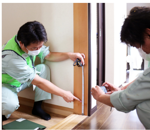
り災証明や被害調査を基に世帯を特定

請書を郵送します。必要事項を記入し、返送してください。2月下旬から順次、振り込み予定です。配分決定以降に受け入れた義援金は、追加配分を行います。 ◎総務課(☎0942・30・9052、FAX0942・30・9706)