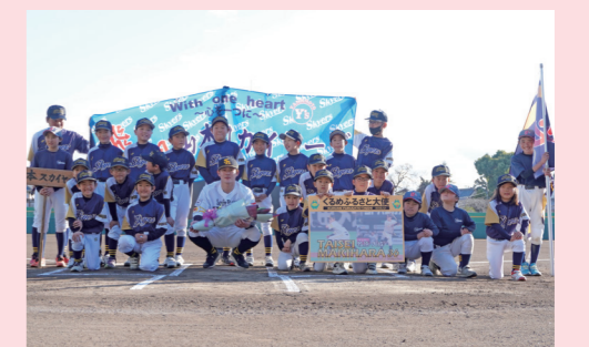
1月6日、本市出身で福岡ソフトバンクホークスの牧原大成選手がくるめふるさと大使に就任。所属していたチームも駆け付けました。