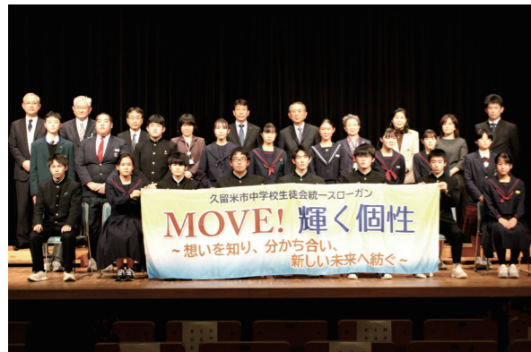
12月24日に行われた発表会では、各校の生徒会長が勢ぞろいしました

市立17中学校の統一スローガンが「MOVE! 輝く個性! 輝く個性! 想いを知り、分かち合い、新しい未来へ紡ぐ!」に決定しました。起こした行動をさらに発展させていこうという思いを込めています。コロナ禍の中、昨年8月から全中学校の生徒会が、オンラインも活用しながら話し合いました。「誰一人取り残されない、個性が大切にされる学校づくり」に向けて各学校で行動していきます。