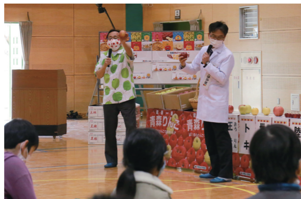
リンゴ柄のシャツとマスク姿で魅力を伝える三村青森県知事（左）

1月13日、荒木小学校でリンゴの魅力を学ぶ授業がありました。青森から三村申吾県知事が来校し、5年生138人にリンゴのおいしい食べ方や種類などを説明。袋かけ体験や競り体験、クイズなどが行われ、児童からは次々に質問も出ました。三村知事は、授業の終わりに「リンゴを話題に、家族とコミュニケーションをとるきっかけになればうれしいです」と話しました。