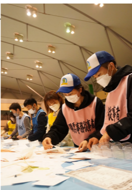
一票ずつ確認しながら開票