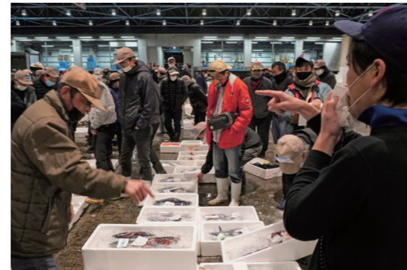
競り人の発声で市場は緊張感に包まれ、買受人は品定めをしながら競り落としていきます

1月5日早朝、市中央卸売市場（諏訪野町）で初競りの取引が盛んに行われた。1年の取引が盛んに行われることを願い、手締めと万歳三唱でスタート。その後の競りでは、競り人の威勢のよい声と共に活発な取引が繰り広げられました。令和4年初日の取引量は、水産部が2万7430kgで約3700万円、青果部は12万7548kgで約4300万円でした。