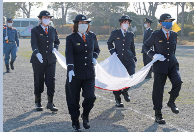
久留米市消防団では、134人の女性団員が活躍しています

災害時、消火や救助活動を安全で迅速に行うには、地元の地理や支援が必要な人がどこに住んでいるかを、良く知っていることが大事です。地域に密着した消防団が果たす人命救助などの役割は大きく、地域防災のリーダーとして期待されています。 18歳以上で市内に住んでいる