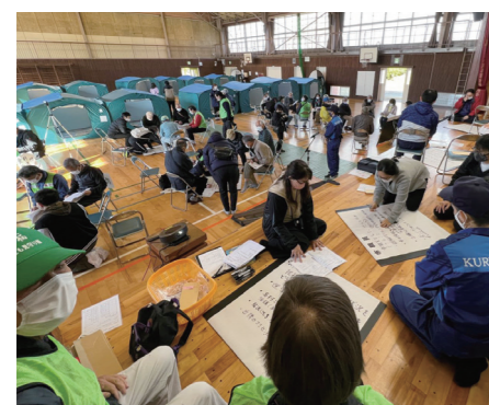
10ページに関連の記事があります