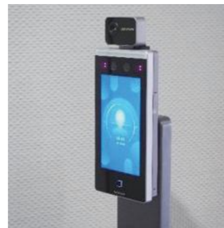
サーマルカメラなど感染防止のための 物品購入に必要な費用を支援します

市内の来店型の店舗などを対 象に、感染拡大防止のための工 事や物品購入に係る費用の3分 の2を支援します。工事、物品 購入合わせて最大60万円、物品 購入のみは最大20万円まで補助 します。 ◎市事業者支援金コールセンタ (☎0942・30・9828、 FAX0942・30・9757)