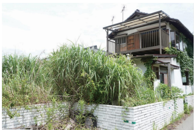
管理不全の空き家・空き地は景観を損ねるだけでなく、周りの住宅にも大きな影響を与えます

地域の生活環境向上のために、適正な状態を保たなければなりません。年に数回の草刈りや樹木の剪定が必要です。自分で管理でき