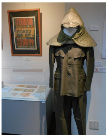
昨年の収蔵資料展の様子

核兵器の恐怖や悲惨な戦争の体験を風化させないために、久留米市は市民の皆さんと平和イベント「くるめ愛と平和の祭典・ピースフルくるめ」に取り組んでいます。予定している主な内容を紹介いたします。いずれも料金は無料。