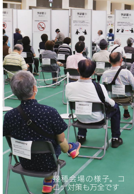
接種会場の様子。コロナ対策も万全です