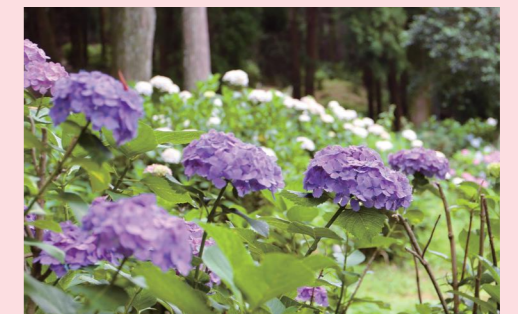
高良山参道脇の約 4,000 株のアジサイが、6月に見頃を迎えました。地元の人によって手入れされ、色鮮やかに咲きました。