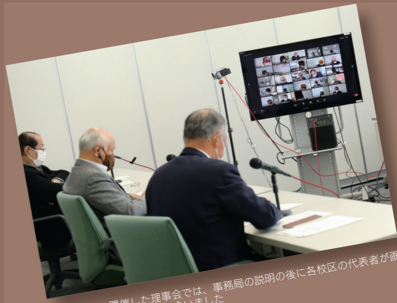
2月10日に開催した理事会では、事務局の説明の後に各校区の代表者が画面上で質問や意見を出し合いました

市内46の校区「コミュニティセンター」は、Wi-Fi環境の整備やSNSによる地域情報の発信などに取り組んでいいます。各校区の代表者が集まる久留米市校区まちづくり連絡協議会も、昨年8月から会議や研修会をWEBを使ってリモートで開催しています。 「コロナ禍でも人とのつながりが途切れないように、オンラインでの会議やタブレット・スマホの使い方の講座など、各校区で工夫を凝らしながらICTを活用した取り組みを進めています。」