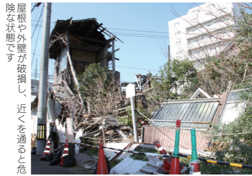
屋根や外壁が破損し、近くを通ると危険な状態です