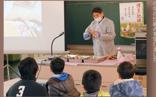
解体を見ながら、肉の部位やニワトリの体の仕組みを学びました