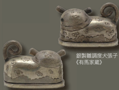
銀製鑪調度犬張子《有馬家蔵》