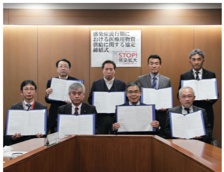
協定書を掲げる事業者の皆さん。流通を通じた医療体制の強化を目指します

——子どもたちの安全を第一に考えて管理されていることが分かりました。新しい環境にも配慮した取り組みが、快適な学校につながっていると思いました。 ◎広報戦略課(☎0942・30・9119、FAX0942・30・9702)