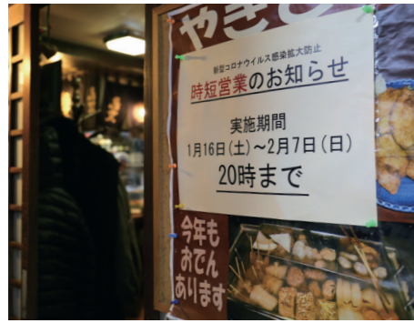
営業時間短縮に協力してもらっている飲食店の様子