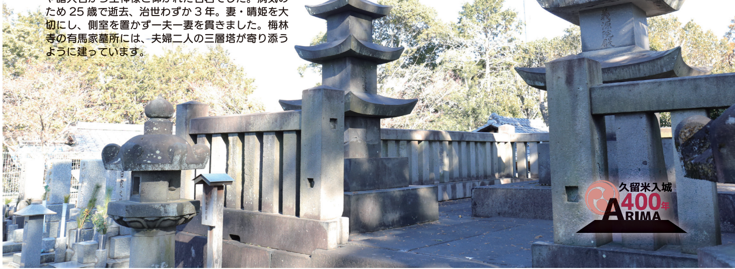
関連情報は7ページ「久留米入城400年モノ語り」です

久留米藩の10代藩主・有馬頼永は、財政再建をはじめ、西洋の脅威に備え軍の近代化、海軍強化など藩政改革を行います。情け深く民を思う姿に領民や諸大名から生神様と仰がれた名君でした。病気のため25歳で逝去、治世わずか3年。妻・晴姫を大切に、側室を置かず一夫一妻を貫きました。梅林寺の有馬家墓所には、夫婦二人の三層塔が寄り添うように建っています。