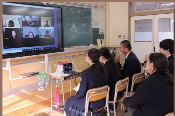
お互いの家族や好きな歌手などの話で盛り上げていました