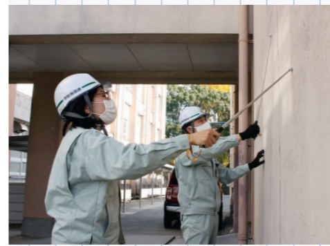
外壁のひびや浮きなどの確認を打診棒を使って確認

——子どもたちの安全を第一に考えて管理されていることが分かりました。新しい環境にも配慮した取り組みが、快適な学校につながっていると思いました。 ◎広報戦略課(☎0942・30・9119、FAX0942・30・9702)