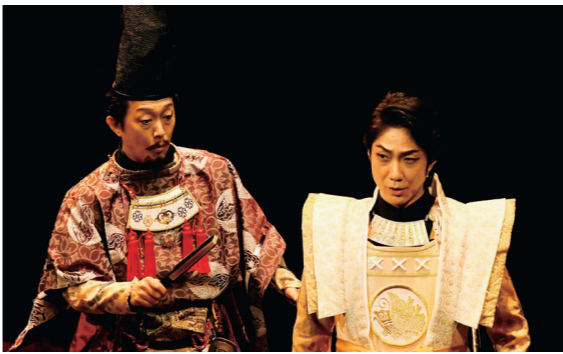
世田谷パブリックシアター「子午線の祀り」(2017)

平成29年に狂言師野村萬齋が新たに演出した本作は、演劇界で高く評価され、数々の演劇賞を受賞。今回、コロナ禍での公演に当たり再構成し、ダイナ