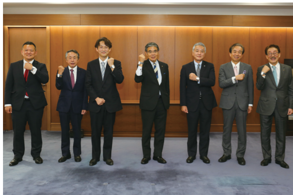
10月11日に本庁舎で大久保勉市長（中央）ら6者の合同記者会見が行われました

睡眠不足が積み重なると健康に影響を及ぼします。睡眠負債の解決を目指し、久留米リサーチパーク内のアクセルスターズを中心に医産学官6者が連携して研究を始めます。今後、市職員とプリンスの従業員の睡眠の質や深さ、時間などのデータを、腕時計型端末で収集。睡眠を見る化して、病気の関連性を調査します。病気の予防や睡眠健診モデル構築が期待されています。