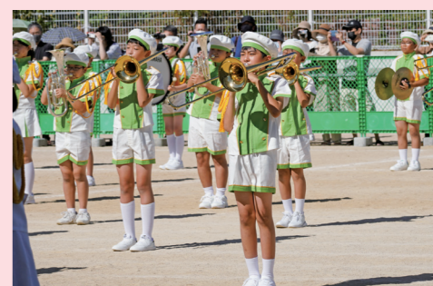
10月14日、篠山小学校で体育発表会がありました。入場制限など感染対策の中で、児童たちは精いっぱい発表しました。