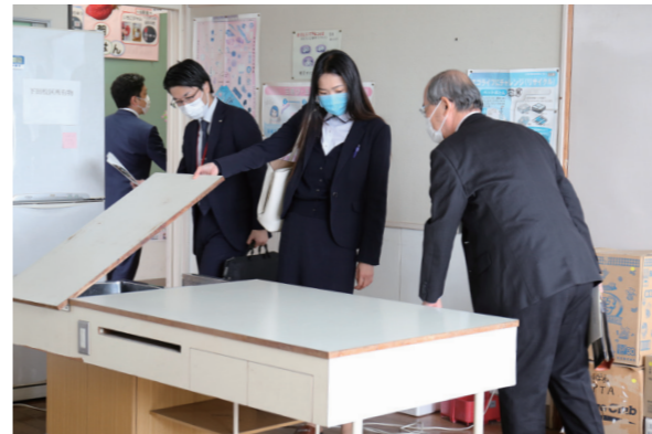
現地見学会に参加した民間事業者の皆さんは、その場で活用のアイデアを出し合っていました

今年3月に閉校した下田小学校の跡地活用の検討が始まりました。地域や行政だけで活用方法を決めるのではなく、民間事業者の意見や新たな提案を公募し、直接対話して検討する「サウンディング型市場調査」を導入。10月19日の現地見学会には8社が参加し、教室や体育館、設備などを確認しました。サウンディングの参加申し込みは、11月12日（金）までです。