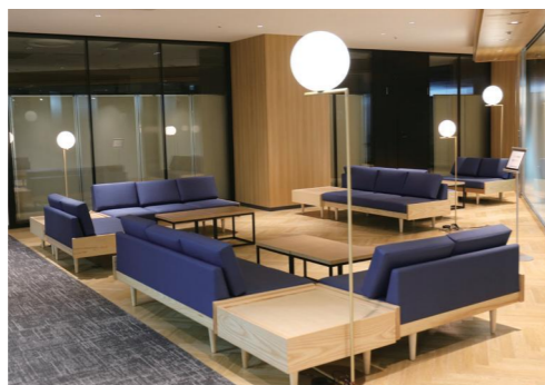
オフィ斯拉ウンジは、商談や打ち合わせスペースとして共同利用ができます