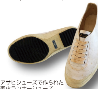
アサヒシューズで作られた聖火ランナーシューズ

■料金無料 ■休館日水曜、第4木曜 ☎文化財保護課 (☎ 30・9322、FAX 30・9714)