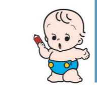
国勢調査イメージキャラクター・センサスくん