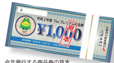
今年発行する商品券の見本

■申込期間 8月13日(土)～9月3日(木)(消印有効)。予定枚数を超えたときは抽選。申込書は各商工団体窓口などに準備 ■利用期間 10月2日(金)～来年2月1日(月) ☎ 商工政策課 (☎ 30-9134、FAX 30-9707)