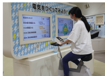
11ページに関連の記事があります