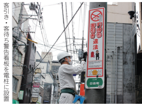
客引き・客待ち警告看板を電柱に設置

悪質で違法な客引きや客待ちをなくすため、文化街の電柱4本に警告看板が取り付けられました。久留米遊技場組合や市防犯協会連合会などの関係団体が共同で設置。文化街への設置は初めてです。当日は、久留米警察署も立ち会いました。違法行為の追放に向けて、今後も久留米警察署や関係団体と連携し、安心して楽しめる街づくりを進めます。 ◎安全安心推進課 ☎0942・3009055、FAX 0942・3009706