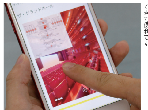
利用する前に、会場内の雰囲気を確認できて便利です