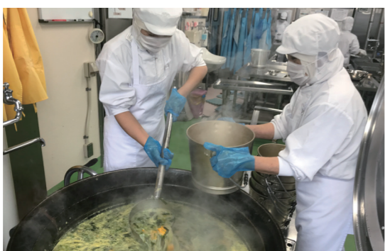
夏でも衛生対策のため、調理着を着ています