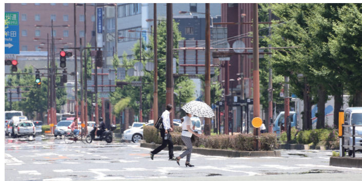
35度を超える猛暑日も。日傘などで直射日光を避けましょう