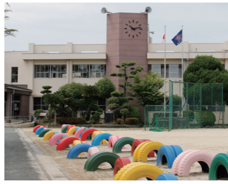
2校の統合先である城島小学校

6月23日の市議会で「久留米市立小学校設置条例の一部を改正する条例」が可決されました。2つの学年を1学級とする複式学級が発生している下田小学校と浮島小学校を、城島小学校に統合します。今後は保護者や地域の代表、校長や市、市教育委員会が構成する協議会を設置。スクールバスの運行や交流学習などについて話し合い、来年4月の統合を目指します。 ◎学校教育課 ☎0942・30・9217、FAX 0942・30・9719