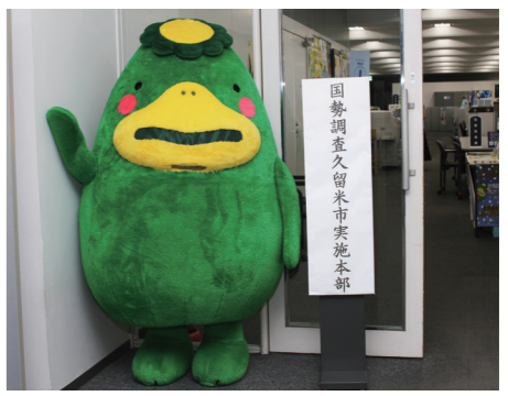
5年に1度行われる大事な調査をくまも応援します

10月1日を基準日として国勢調査が実施されます。円滑、正確に調査するため、6月1日日本庁舎7階に実施本部を設置。国内に住む全ての人が対象で、国や地方公共団体の施策の資料に利用されるだけでなく、企業や学術、研究機関にも提供される重要な調査です。9月頃に各世帯に調査員が訪問する予定です。 ◎国勢調査久留米市実施本部(総務課内) ☎0942・30・9053、FAX 0942・30・9706