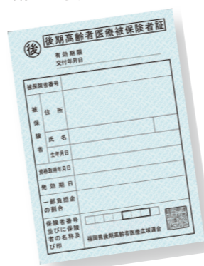
8月からは水色の保険証です

今年度の納付通知書は7月13日(月)に発送します。保険料は年金から天引きされます。口座振替を希望する人は申請が必要です。