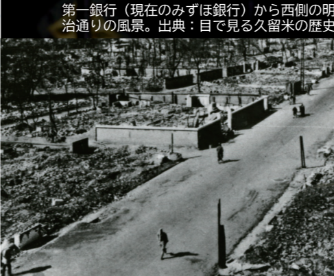
第一銀行（現在のみずほ銀行）から西側の明治通りの風景。

終戦の年の昭和20（1945）年は、14歳で久留米高等女学校（現在の明善高校）の2年生でした。授業ではモリス信号や手旗信号を習いました。水も食料も持たず40km歩かされたこと