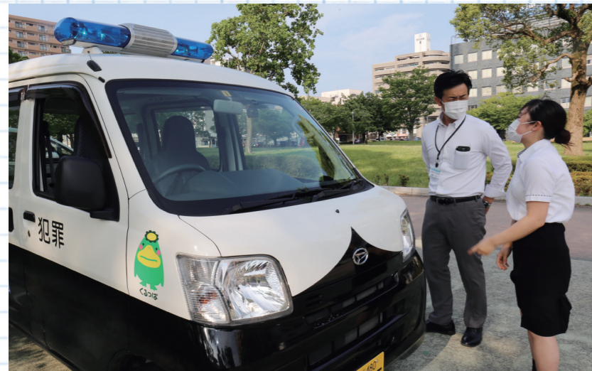
防犯パトロールをする青パトには、注意喚起をするスピーカーを取り付けています

「巻き込まれないためにはどうしたらよいですか？」 このような犯罪の背景には、多くの場合、暴力団などの反社会的勢力が関わっています。被害者からたまし取った金は、暴力団の活動資金になります。学生をターゲットにして、「短時間で高収入が得られる」とSN