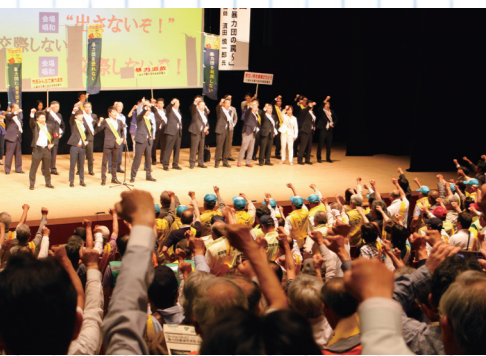
暴力団壊滅市民総決起大会の最後は、参加者全員でシュプレヒコールをします

助金や公共工事など市の事業が暴力団の資金源にならないよう徹底しています。年に2回「暴力団壊滅市民総決起大会」を開催して、市民の皆さんと一緒に、市民の皆さんと一緒に、暴力団壊滅の機運を高めています。各校区の防犯活動の支援や市内の中・高校で、暴力団関連の講話や薬物乱用防止の教育など地域と警察で連携しながら取り組んでいます。皆さん一人一人が、犯罪の実態を知ることでも犯罪抑止になりますね。 「犯罪に巻き込まれないためには、正しい情報を得て、しっかり判断することが大切だと学びました。少しでも怪しいと思ったら、まずは周りの大人にしっかり相談をします。当事者意識を持つことが大事だと実感しました。」 ◎広報戦略課 ☎0942・3・309119、FAX0942・309702