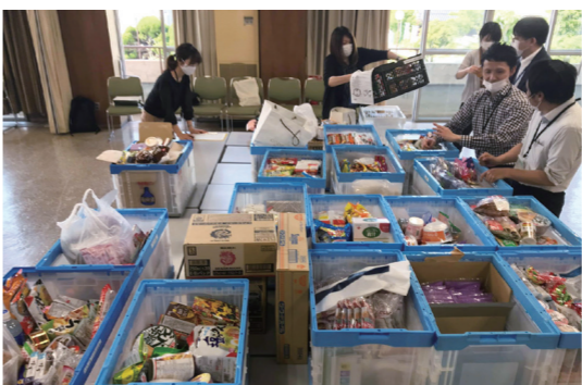
配るだけでなく、食材集めや仕分けも補助対象に

バンクなどの活動を行うボランティア団体などに、活動費を助成します。対象は、活動時の交通費、食材などを保管する場所の賃借料、消耗品や印刷などの費用です。