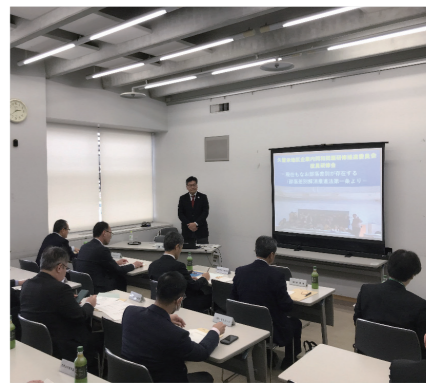
昨年度、開催された企同推の研修の様子

全国統一応募用紙（※2）が生まれました。面接でも、本人の適性や能力とは関係ない質問はしないよう、事前に面接官が互いに確認します。自分が発した言葉が、相手に大きな苦痛を与えてしまうかもしれません。何気なく使っている言葉が指摘されるまで差別につながる言葉と知らなかった、気付かなかったことがあるためです。企業にはさまざまな人がいます。同和教育も地域差があるため、