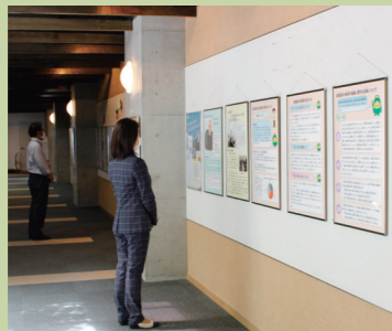
先人たちの思いを伝えるパネル展