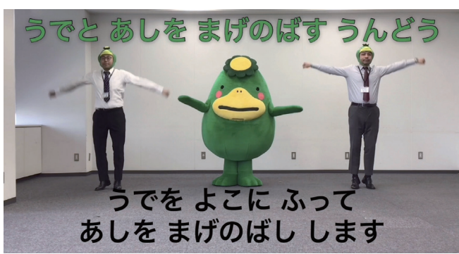
くるっぱとラジオ体操の動画を配信。自宅で運動不足を解消

休校で給食の提供ができず、家計に影響が出ています。就学援助受給世帯の子どもたちを対象に、一人当たり20kg相当の「おこめ券」を支給します。 ◎学校保健課 (☎0942・309273、FAX0942・309719)