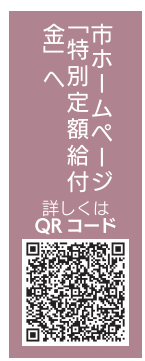
市ホームページ「特別定額給付金」へは詳しくはQRコード

【対象】4月分の児童手当を受給する人。3月分受給を含む 【給付額】児童一人に1万円 【子育て世帯臨時特別給付金】 ◎特別定額給付金プロジェクト (☎0942・309757、FAX0942・309742)