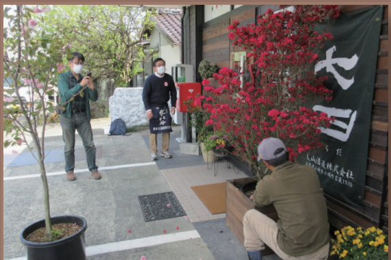
店の入り口にリースした色鮮やかな久留米つつじが設置されました