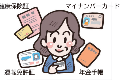
本人確認できる物の例

◆オンラインで申請する場合 顔写真付きマイナンバーカードを持っている人が利用できます。パソコンやスマホで総務省の特設サイトからマイナンバー ◆郵送で申請する場合 申請書に振込先口座情報を記入。本人確認できる物の写し、振込先通帳の写しを貼付して返送。郵送申請分は5月下旬からの給付開始を予定しています。