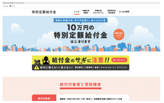
総務省の特別定額給付金の特設サイト

感染者の拡大を防止するには、人との接触を減らし3密を避けることが重要です。市は、施設の休館、イベントの中止、学校の休校を延長することを決定しました。