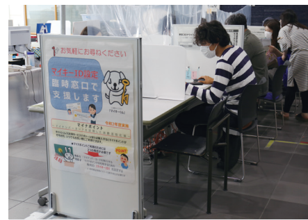
4ページに関連の記事があります