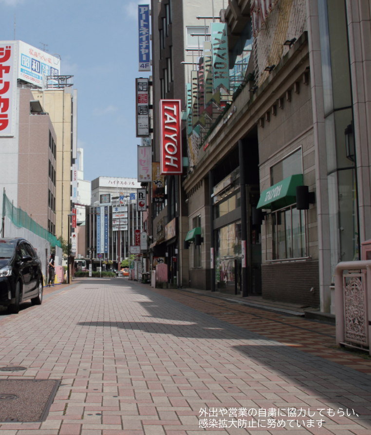
外出や営業の自粛に協力してもらい、感染拡大防止に努めています