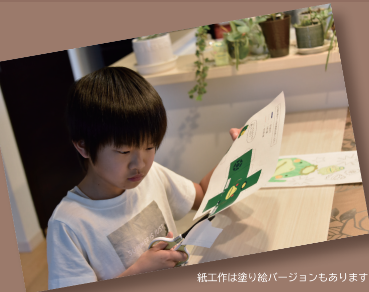
紙工作は塗り絵バージョンもあります