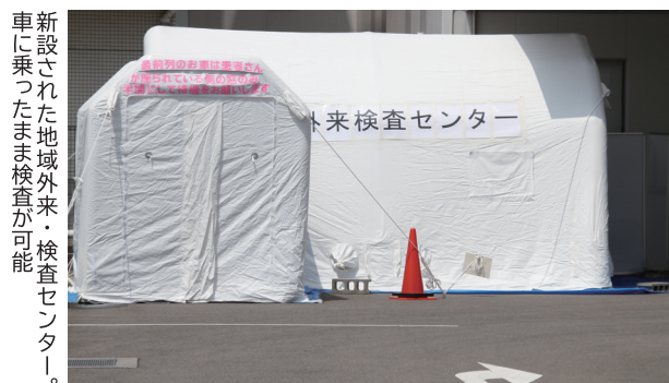
新設された地域外来・検査センター。車に乗ったまま検査が可能