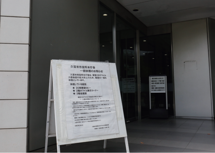
本庁舎3階会議室、20階展望ロビーは休館しています

公共施設 休館する施設は、久留米シティプラザ、図書館・室、エーピア久留米、美術館、鳥類センターなど193施設です。ただし、状況に応じて休館を見直すこともあります。本庁舎、各総合支所、各市民センター、環境部庁舎、斎場、市立保育園、学童保育所などは、引き続き利用できます。 イベント 5月31日(日)までに市が主催・