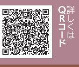
市ホームページ「コロナに便乗した悪質商法や詐欺に注意」へ詳しくはQRコード

新型コロナウイルスに便乗した悪質商法や詐欺が多発しています。慌てず、冷静な対応が大事です。 【マスク送りつけ商法】 注文していないマスクが送られてきた。受け取ると後日、高額請求書も送られてきた。 【成り済まし詐欺】 家族を名乗り「新型コロナ関係の仕事をしている。大事な書類を無くした。お金がない」と電話があった。 【特別定額給付金の代理申請詐欺】 国から特別定額給付金の代理申請委託団体と名乗った電話があった。手数料が掛かるが、氏名や振込銀行口座番号を教えるように言われた。 【特別定額給付金の振込詐欺】 市職員を名乗り、給付金を支給するのでATMで操作してくださいと電話があった。 少しでもおかしいと思ったら、家族や警察、消費生活センターに相談してください。 ◎消費生活センター (☎0942・307700、FAX0942・307715)