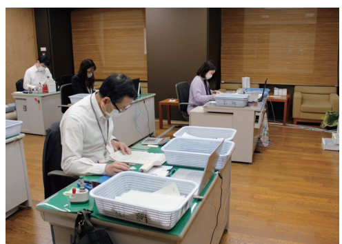
会議室を利用して業務エリアの分散化に取り組んでいます

対策の要となる保健所は業務の一部を会議室に移し、他部署から職員を増強。体制を強化しました。保健所機能を維持し、コロナウイルス対応の長期化に備えるのが目的です。本庁舎でも、執務エリアを会議室などに分散化。時差出勤や在宅勤務なども行いながら職員の感染を防止し、市民サービスを維持しています。