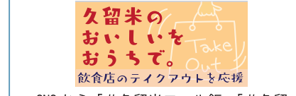
SNSから「#久留米エール飯」「#久留米お弁当プロジェクト」を検索できます

外出の自粛要請や休業要請で、飲食店は営業を続けられず悲鳴を上げています。家でも店の味を楽しめる「テイクアウト」できる飲食店が続々と。飲食店が発信する情報を、市ホームページで見ることができます。