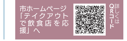
市ホームページ「テイクアウトで飲食店を応援」へ詳しくはQRコード