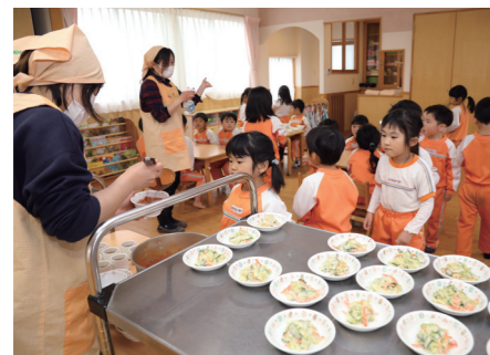
2～3ページに関連の記事があります