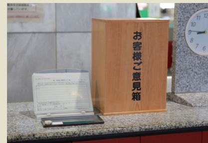
その場で記入しご意見箱へ

市民の皆さんからの意見を市政に生かすために、「ご意見箱」を本庁舎1階の総合案内や各総合支所、各市民センターに置いています。まちづくりへの意見や提案などを書いて投函してください。市ホームページでも受け付けています。