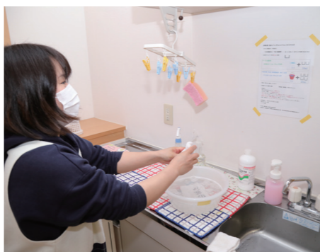
消毒液の作り方を貼って確実な消毒作業