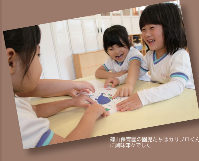
篠山保育園の園児たちはカリブロくんに興味津々でした

久留米信愛短期大学で、学生15人が子どもたちの食育のために絵本を制作しました。タイトルは「カリブロくん」。味はブロッコリー、食感ばかりフラワーのカリブロを主人公に、久留米で生産されている由来や食の大切さを紹介しています。親しみやすいようなキャラクター設定や色合いを工夫。絵は学生の手描きです。3月30日、完成した100冊を市内の保育所や幼稚園、認定こども園に贈呈。子どもたちは早速、楽しそうに絵本を開いていました。