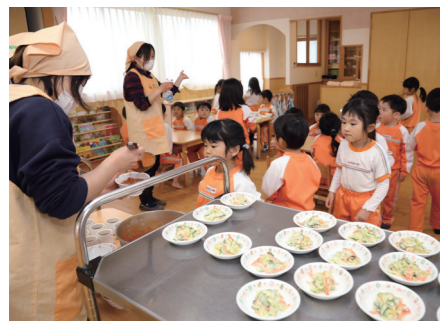
2～3ページに関連の記事があります