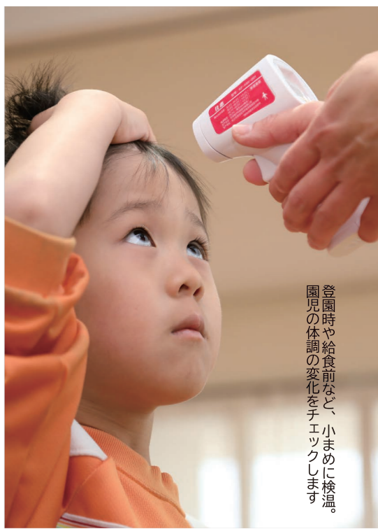
登園時や給食前など、小まめに検温。園児の体調の変化をチェックします