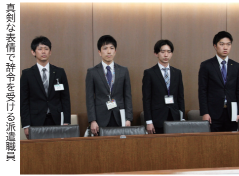
真剣な表情で辞令を受ける派遣職員