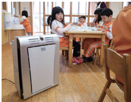
補助金を活用して購入した空気清浄機が活躍