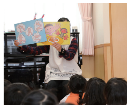
紙芝居で楽しく手洗いを学びます