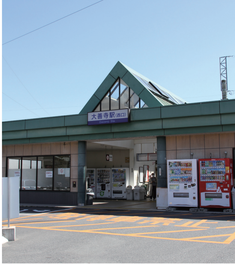
地域生活拠点の一つである西鉄大善寺駅周辺。規制緩和で開発を促進します