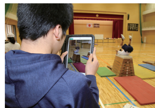
教育ICTを活用して、学習の効率化を図ります

⑥健康で生きがいを持てるまち 生活習慣病の発症・重症化予防対策、予防接種や特定感染症予防対策などに取り組みます。地域での支え合いの仕組みづくり、生活に困っている人や障害のある人などの相談支援の拡充を進めます。