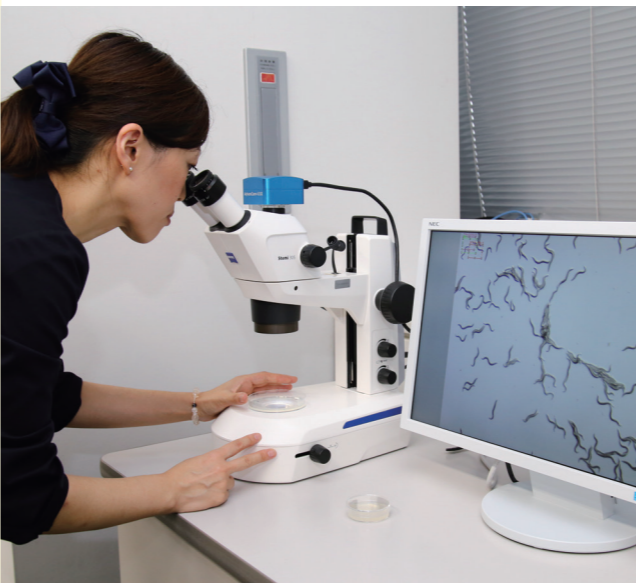
九州大学発のベンチャー企業「HIRÔTSU バイオサイエンス」は、線画を使ったがん検査を開発。市は同社の開発・実用化を支援。昨年12月には市職員の尿を提供するなど、装置の運用試験に協力しました

2556万円 地域資源を活用した観光商品づくりや、プロモーション強化を目的とした冊子の製作に取り組みます。