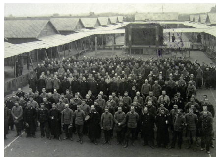
2ページに関連の記事があります