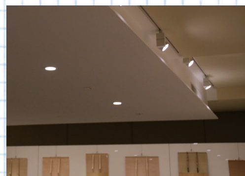
作品の材質などに合わせて展示室ごとに照明を細かく調整します