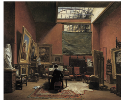
アリ・ヨハネス・ランメ《アリ・シェフェール邸(パリ、シャブタル通り16番)の小さなアトリエ》1850年 油彩・カンバス ドルトレヒト美術館