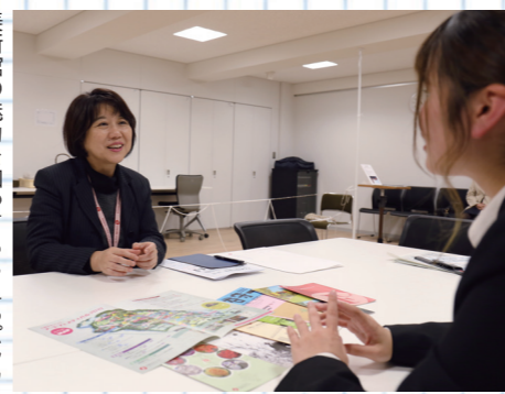
美術館の魅力を知ってもらえるパンフレットもたくさん

作品の特色はもちろん、流行やニーズとのバランスを見て内容を決めていきます。さまざまなジャンルの作品の展示ができるように、他の美術館などと調整して進めます。