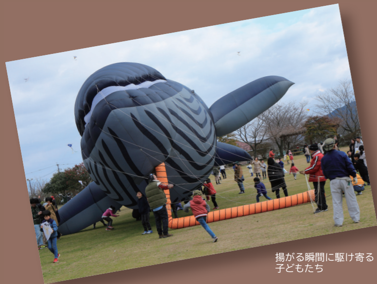
揚がる瞬間に駆け寄り子どもたち