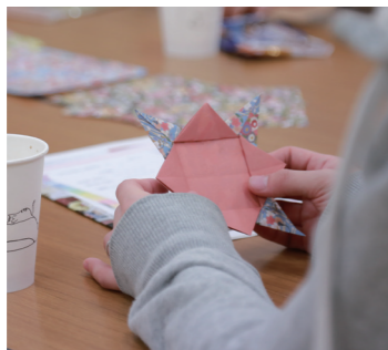
座談会には「季節の手仕事」を交え、楽しさも大切にします。この日は折り紙でこまづくり