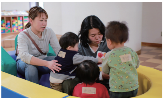
託児サービスも用意。子どもたちは、くるるん「あそびのひろば」で楽しく過ごします