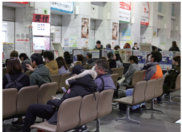
本庁舎1階の市民課には、毎日約400人が来庁。特に、月曜日や連休明けは混み合います

年末年始の長期休暇や自動交付機が終了したことで、年明けから市民課を利用する人が増え、窓口が混雑しています。 久留米市は、1月6日からマイナンバーカードを使って、各種証明書を取れるサービスを始めました。マルチコピー機があるコンビニエンスストアで、住民票の写し、印鑑登録証明書、所得証明書、戸籍全部（個人）事項証明書が取れます。全国どこでもコンビニでも利用可能。土・日曜、祝日も証明書を取ることができます。