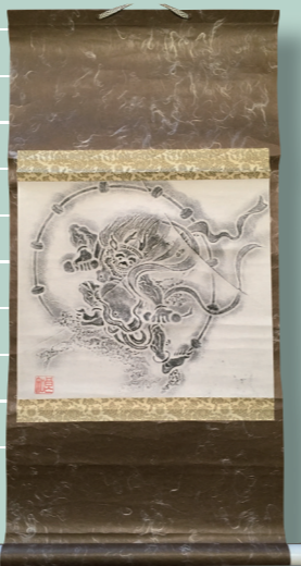
表装された拓本。和柄が外国人観光客に人気です