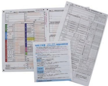
市・県民税、確定申告の申告書。インターネットでも作れます

久留米税務署（諏訪野町）で、所得税や贈与税、消費税などの申告相談を受けられます。2月17日(月)からの9時～16時です。 ◎市民税課 ☎0942・30・9008、FAX0942・30・9753