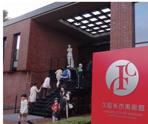
多くの来館者でにぎわう市美術館