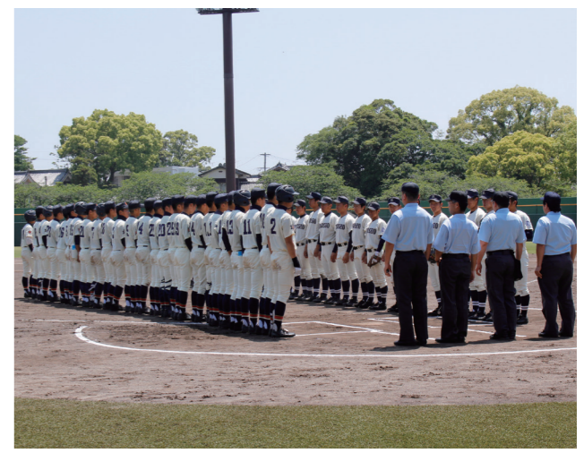
昭和22年から続く伝統の野球交流戦「久南定期戦」。客席に詰めかけた両校生徒の応援も見ものです

久留米市は12月、ふるさと納税制度を活用し、市立久留米商業高校と南筑高校の部活動や教育環境の整備に充てる、新たな制度を始めました。寄付ができるのは市外に住んでいる人で、いずれかの学校を指定します。応援が目的のため、返礼品はありません。寄付のうち、事務経費を除いた9割を事業に活用します。寄付者は卒業生の他、世界や全国で活躍するチームや選手が多い両校の部活動の応援者なども想定。市外に住む家族や親戚などへの市民の皆さんからの口コミは、寄付増