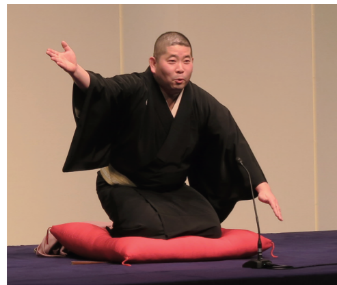
昨年2月に行われた桃月庵白酒独演会