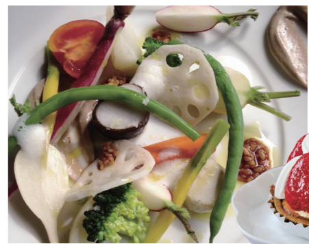
久留米野菜のバーニャカウダ

久留米産の農産物をおいしく食べて、知ってもらうため市内の飲食店やホテルなど16店舗が自慢の料理を提供する「くくるめグルフェア」を開催します。