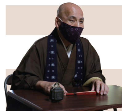
梅林寺 東海大玄住職 「修行の基本は掃除。一日も怠ることなく、続けてきたからこそです」と話しました