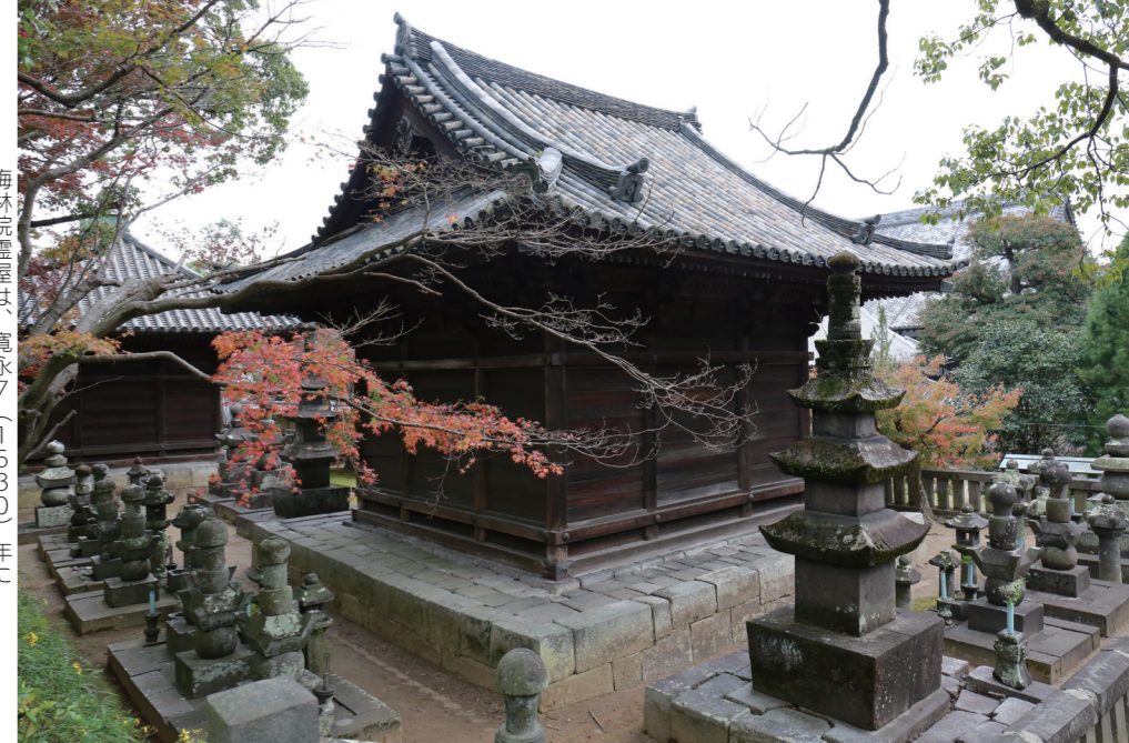
梅林院霊屋は、寛永7（1630）年に建てられた伝統的な和様三間仏堂です。

京町の梅林寺境内には、久留米藩を治めた有馬家の歴代藩主や一族、殉死した家臣を祭る墓所があります。11月20日、国の文化審議会は有馬家墓所 2,450㎡を国の史跡に指定するよう答申しました。