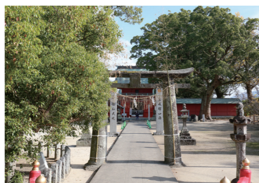
平成29年10月に歴史の森に指定された北野天満宮

■金額 ①一本当たり年間3000円。②③④一本から10本までは1万円、11本から20本までは2万円、21本以上は3万円 ☎公園緑化推進課 (☎ 0942・30・9087、FAX 0942・30・9707)