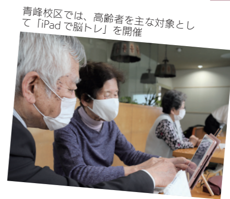
青峰校区では、高齢者を主な対象として「iPadで脳トレ」を開催