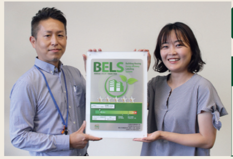
ZEB 認証取得 全国自治体初 環境部庁舎が最高ランクの ZEB 認証を取得。自治体の既存建物で全国初です