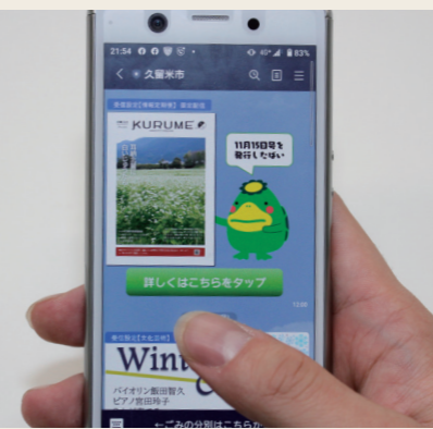
公式 LINE スタート 欲しい情報が手元に 新型コロナウイルスの発生や災害情報、暮らしに役立つ情報などをリアルタイムに配信。スタート 4 カ月で利用者が 3 万人を突破しました