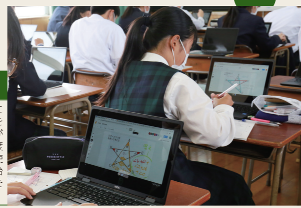
GIGA スクール構想に向け始動 GIGA スクール実現に向けて、パソコンを使った初の公開授業が行われました。来年度から授業で本格的に使用されます。1人1台導入に向けて、整備を行っています