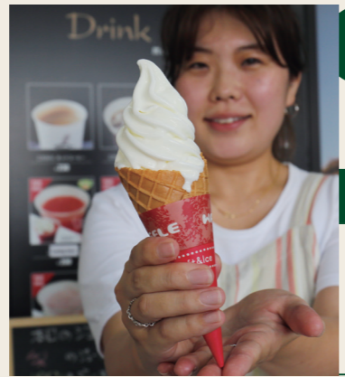
道の駅くるめのソフトが西日本1位に 道の駅ひんやりスイーツ総選挙 2020 で西日本総合第 1 位に。久留米産 100% のジャージー牛乳を使用。コクがあるのにさっぱりした味わいです