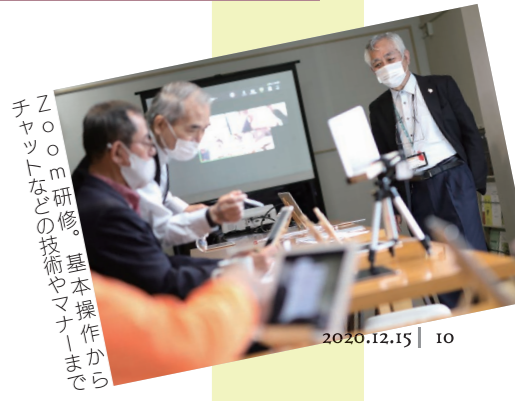
Zoom研修。基本操作からチャットなどの技術やマナーまで