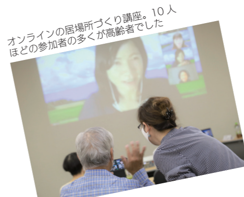
オンラインの居場所づくり講座。10人ほどの参加者の多くが高齢者でした