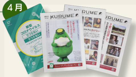
新型コロナ対策・支援策を実施 広報紙でも呼び掛け 4 月に市議会（臨時会）で新型コロナ関連補正予算を可決。以後、支援策を継続して打ち出しました。本紙 5 月 1 日号には対策冊子を折り込むなど対策も呼び掛けました