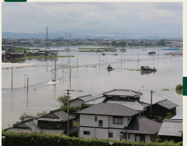
令和2年7月豪雨 浸水被害 梅雨前線が停滞し、線状降水帯が発生。7月6日から断続的に雨が降り続き、観測史上 24 時間最大雨量を記録