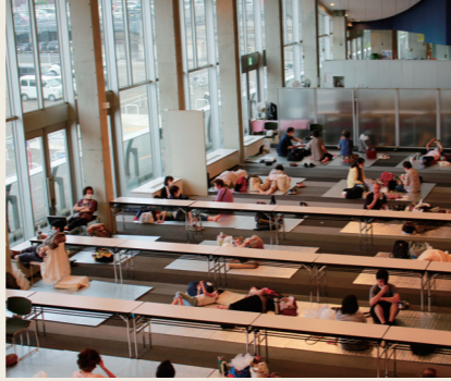
台風 10 号接近でコロナ対策をして避難 台風 10 号の最大瞬間風速は 29.9m、観測史上 2 位を記録しました。コロナ対策のため避難所の人数制限を行い、人との間隔も保ちました