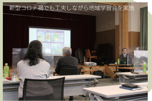
新型コロナウイルス禍でも工夫しながら地域学習会を実施

各校区の人権啓発推進協議会と連携し、新型コロナウイルスをテーマに小規模な人権学習会を開催しています。会場は校区「コミュニティセンター」などで、感染防止対策を徹底。新型コロナウイルスによる差別の事例や、もし自分の周り