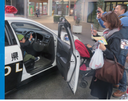
パトカーや白バイの周りは写真撮影で大にぎわいです