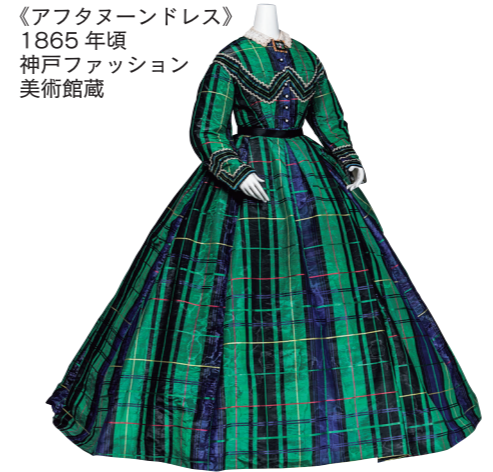
《アフタヌーンドレス》 1865年頃 神戸ファッション 美術館蔵

知られざるタータンの世界 タータンとは、スコットランド北西部で発展した織物で、日本では「タータンチェック」として広く親しまれてきました。その普遍的なデザインは、マフラーやスカートなどの衣類から、インテリアや小物類まで日常のあらゆるところで使われています。 展覧会では、あまりなじみのないさまざまなタータン生地約100点をはじめ、19世紀にスコットランドのエディンバラで活躍した風刺画家ジョン・ケイの版画、現在活躍中のファッションデザイナーの衣装、日本とタータンの関わりを示す資料など約270点を展示。タータンの歴史や社会的、文化的背景を紹介し、そこに込められた意味や魅力を探ります。