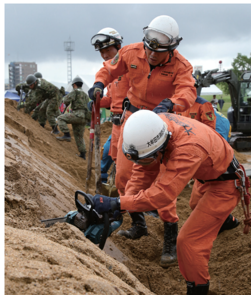
チェーンソーを用いて訓練する消防士(昨年の様子)

急復旧、ボートの取り扱い、水防訓練など 【展示・体験】防災備蓄品の展示や災害現場での活動報告、地震体験車による地震体験、初期消火体験など ■日時 9月1日(日)訓練10時~12時、展示・体験9時30分~12時30分 ■会場 上津小学校 ■申し込み不要 ■防災対策課 ☎0942・30・9074、FAX0942・30・9712