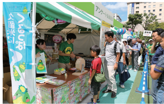
抽選会には長蛇の列(昨年の様子)