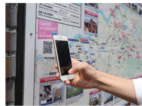
各所に設置されたQRコードを読み取ります

救急車を呼ぶか、病院に行くか迷ったときは救急電話相談・医療機関案内 プッシュコ回線#7119または☎09924710099へ、24時間受け付け