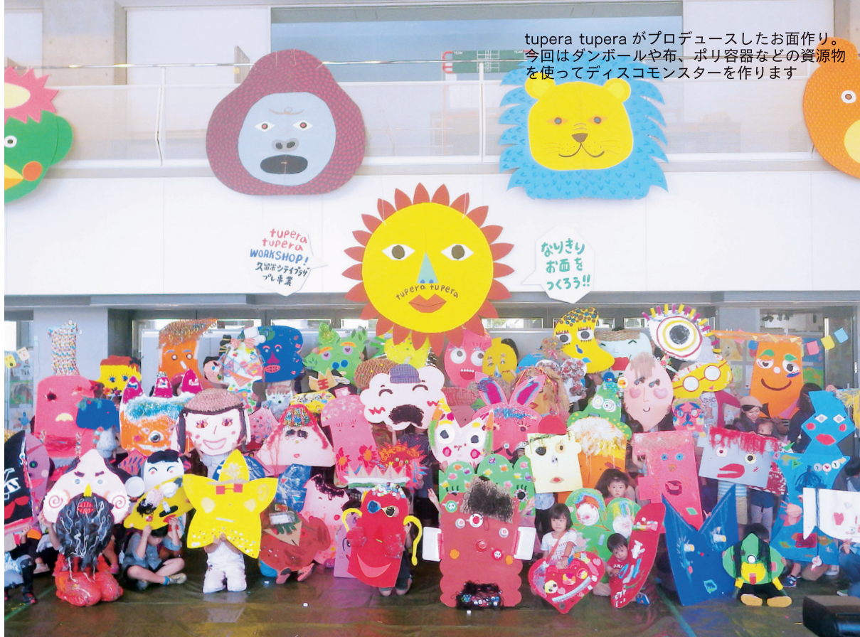
tupera tupera がプロデュースしたお面作り。今回はダンボールや布、ポリ容器などの資源物を使ってディスプレイコモンスターを作ります