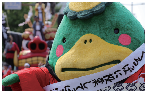
応援よろしくっば

◎シティプロモーション課 ☎0942・30・9228、FAX 0942・30・9703