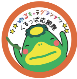
缶バッジのデザイン