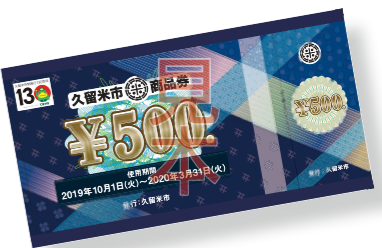
今回販売する久留米市のプレミアム付商品券(見本)

今回のプレミアム付商品券は増税による負担軽減が目的の国の事業。子育て世帯主など限られた人が対象です。毎年、商工団体が販売する商品券とは違うものです。