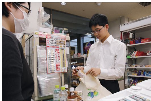
買い物では忘れずにエコバッグを持参