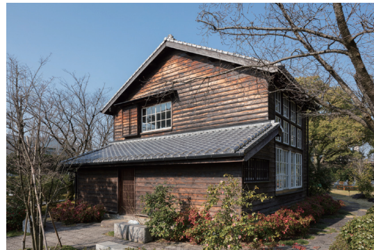
坂本繁二郎旧アトリエ