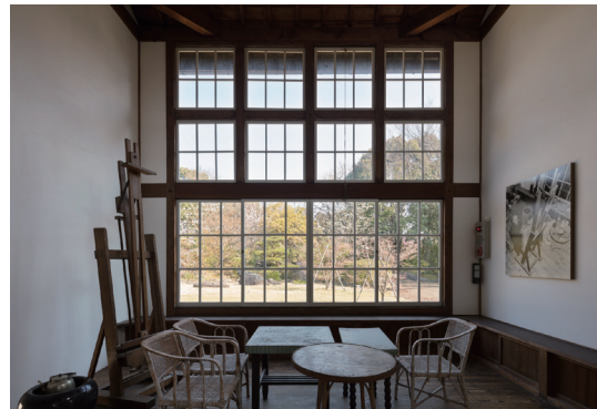
キャンバスを立て掛ける画架や家具は当時のまま