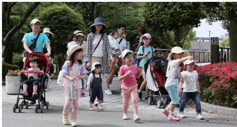
キッズウォークはベビーカーでも参加できます(昨年の様子)

◎久留米つつじマーチ実行委員会事務局 (久留米観光コンベンション国際交流協会内、☎0942・31・1777、FAX 0942・31・3210)