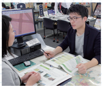
景観計画の成り立ちや役割について話を聞きました

こととは、歴史、文化、産業などで新たな活力を生み出し、市への愛着や誇り、満足度の向上につながると思っています。景観づくりの過程で、住む人同士が自分のまちの良さや課題を考え、きつかけになり、地域も活性化するのではないのでしょうか。