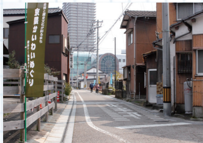
JR久留米駅西口から京町地区にかけて続く散策路

計画では、市全体を6地域に分けています。それぞれ建物の色や高さなどのルールを定め、統一感がありつつも、地域性のある景観づくりを進めています。中でも特徴のある地域として、京町を市で最初の景観重点地区に指定し、その地区の魅力を高める取り組みにつなげています。