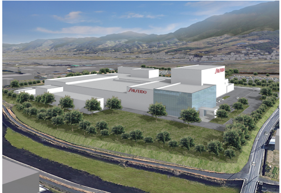
資生堂の新工場の完成イメージ

県と久留米市、うきは市が整備し、1月に分譲を始めた久留米・うきは工業団地に、化粧品製造大手、資生堂の進出が決まりました。同社工場は2020年に着工、2021年の稼働を予定しています。