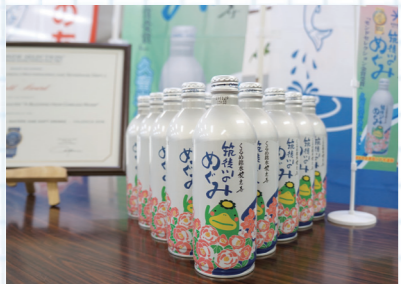
モンドセレクションの審査では試飲や化学分析などが行われました

筑後川は、流域に工場などが少ないので、とてもきれいなんですよ。久留米市の水は平成30年にモンドセレクションで金賞を受賞し、「安全性」と「おいしさ」について国際的な高い評価も得ています。