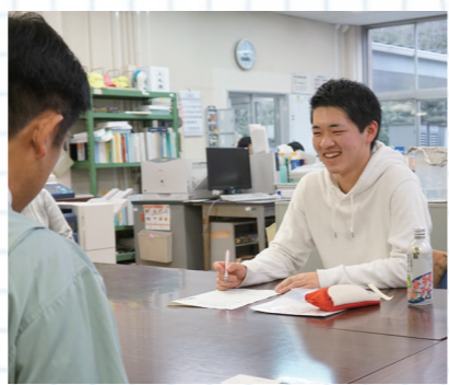
「筑後川のめぐみ」は、熊本地震など市外の災害でも配布されたそうです

で民間企業に委託しています。しかし、安全でおいしい水道水を作り、家庭に届けるという部分は、これからも市がしっかりと取り組んでいきます。