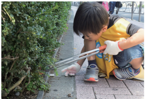
垣根の中などに隠れたごみを見つけている様子

3月16日(土)にブリヂストンと久留米市が主催してスポGOMI大会inくるめを開催します。スポGOMIは、チームの仲間と力を合わせて、制限時間内に拾ったごみの種類と量を競います。今までのごみ拾いには社会奉仕のイメージがありました。スポGOMIは誰もが楽しく参加できる地球に優しいスポーツです。近年、全国的に企業や団体などで取り組まれています。