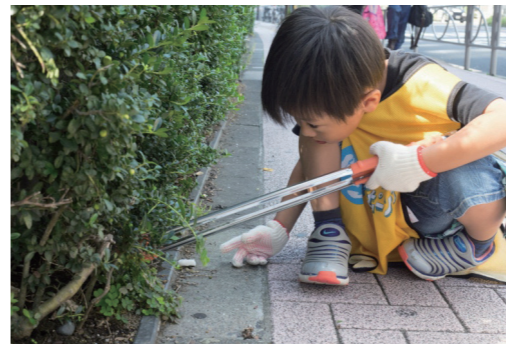
垣根の中などに隠れたごみを見つけている様子

3月16日(土)にブリヂストンと久留米市が主催してスポGOMI大会inくるめを開催します。スポGOMIは、チームの仲間と力を合わせて、制限時間内に拾ったごみの種類と量を競います。今までのごみ拾いには社会奉仕のイメージがありましたが、スポGOMIは誰もが楽しく参加できる地球に優しいスポーツです。近年、全国的に企業や団体などで取り組まれています。