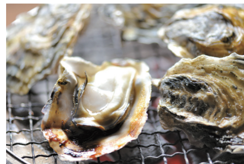
4～5ページに関連の記事があります