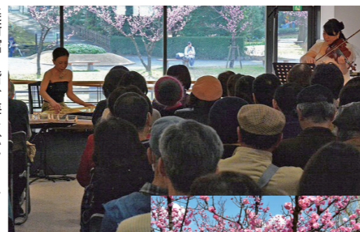
美術館1階で梅をバックに