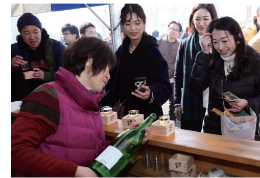
メイン会場の角打ちコーナー（昨年の様子）

◆開放酒蔵 限定酒の試飲・販売の他、酒や酒かすを使った料理や菓子なども販売。蔵ごとに趣向を凝らしたイベントも開かれます。