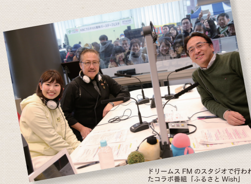
ドリームス FM のスタジオで行われたコラボ番組「ふるさと Wish」

1月12日、「ふるさと Wish」KBCラジオ65周年バースデーフェスタが、創業の地である六角堂広場で開かれ、多くの来場者でにぎわいました。会場では、ラジオ公開生放送や地元ドリームスFMとのコラボレーション番組の生放送、ステージイベントなどがありました。舞台には、ふるさと大使の石橋凌さんをはじめ、同局の名物パーソナリティーや歴代のリポーターが登場し、会場を盛り上げました。