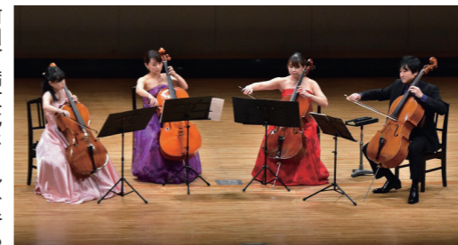
前回石橋文化ホールで行ったミュージアムコンサート