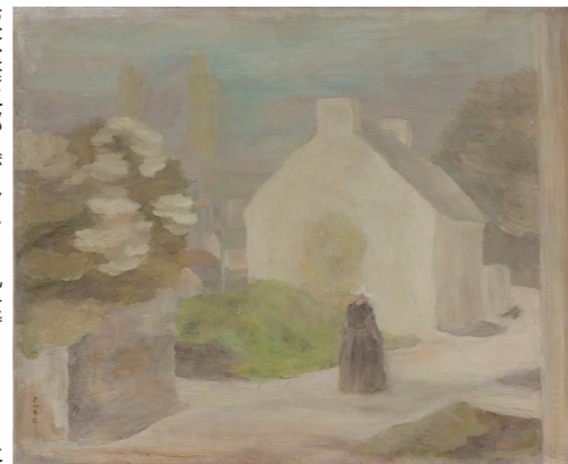
坂本繁二郎《ヴァンヌ風景》1923年 久留米市美術館蔵