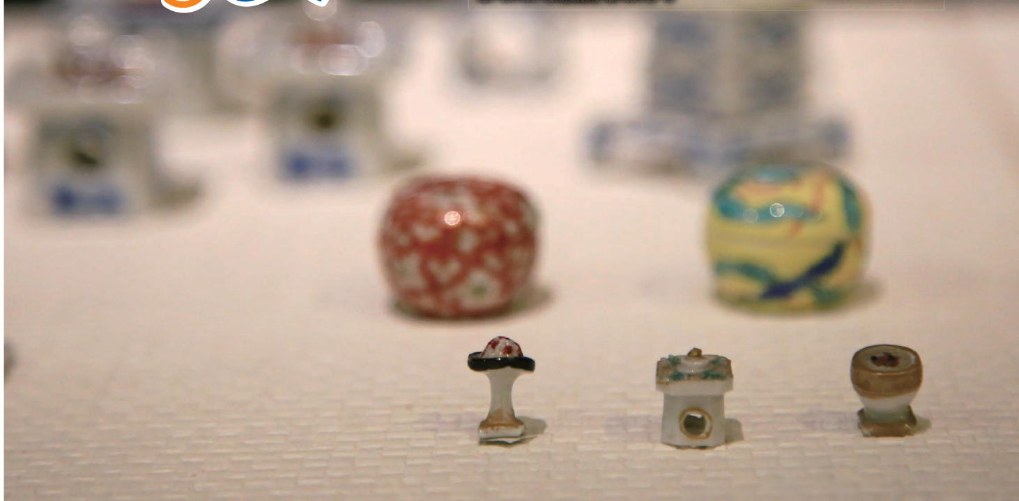
2月2日(土)から有馬記念館で開催される企画展「ミニチュアひな道具の世界」では、信じられないほど小さな置き物が展示されます。供え物を模したこの磁器の高さは約1cmです