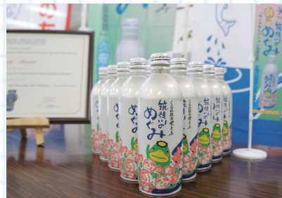
モンドセレクションの審査では試飲や化学分析などが行われました

筑後川は、流域に工場などが少ないので、とてもきれいなんですよ。久留米市の水は平成30年にモンドセレクションで金賞を受賞し、「安全性」と「おいしさ」について国際的な高い評価も得ています。