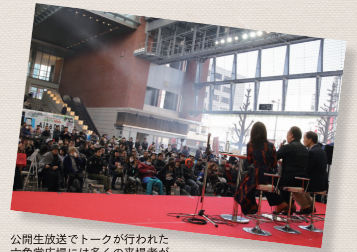
公開生放送でトークが行われた六角堂広場には多くの来場者が